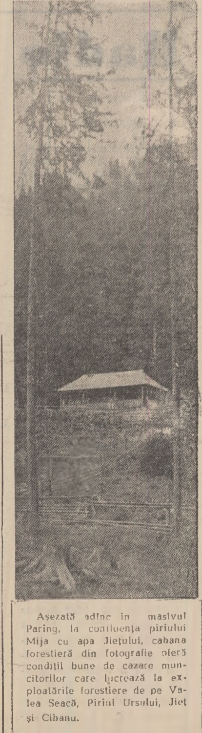
Asezată adine în maelul paring, la conluența pîrului Mija cu apa Jiefului, cabana forestieră din fotografie oferă condiții bune de cazare muncitorilor care lucrează la exploatarea forestiere de pe Valea Seacă, Pîrîul Ursului, Jiet și Cîhanu.