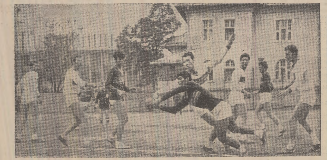
Roman nu va reuși nici de această dată să concetizeze.

troputere. Autorii punctelor victoriei merită să fie notați aici, deoarece toate încercările au fost realizate în urma unor acțiuni spectaculoase și de mare finețe, mult apreciate de spectatori. Aceștia au fost: Procup (9), Ștef (3), Roth (3), Mihăila (6), Tripun (3), Rosu (3), Balazs (12) și Szöke (2). A fost un meci frumos, în care gazdele și-au dominat net adversarii înscind din acțiuni construite cu măiestrie. I. C.