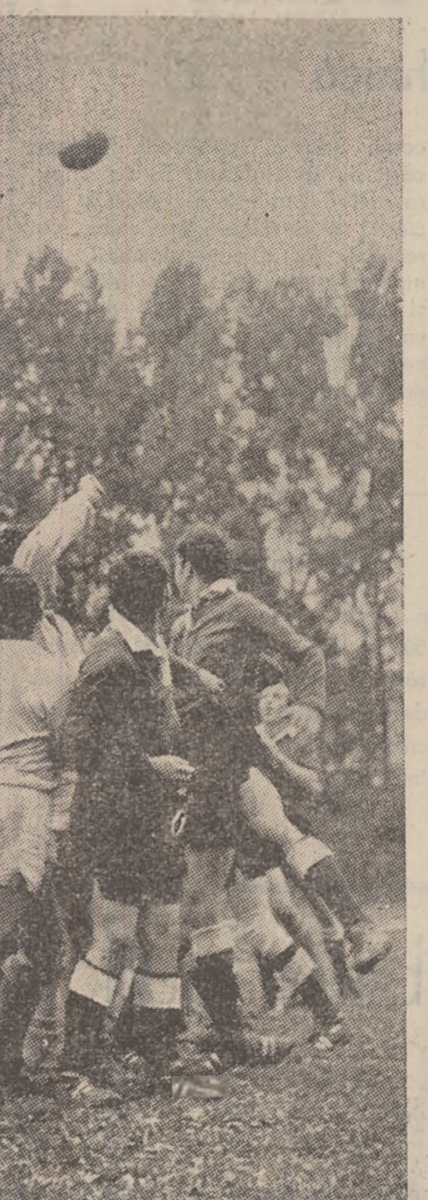
Aspect din timpul meciului de rugbi dintre Minerul Lupeni și Metalul Turnu Severin.