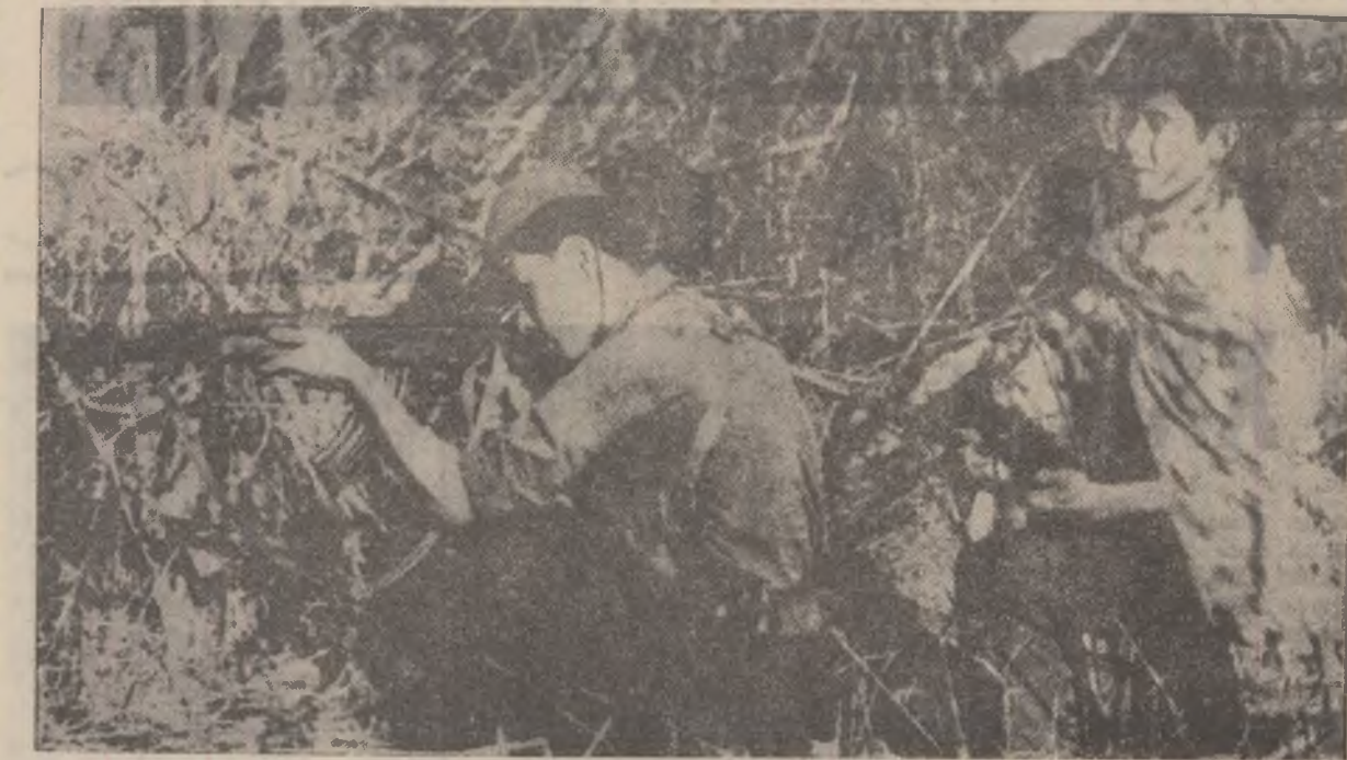
VIETNAMUL DE SUD: Membri ai forțelor patriotice care acționează pe teritoriul Vietnamului de Sud, interceptînd un atac al inamicului lângă Gia Dinh.

Un popor care duce cu succes lupta pentru eliberare și pune totodată bazele independenței poporului va învinge neapărat. (din săptămînalul englez „Comment”)