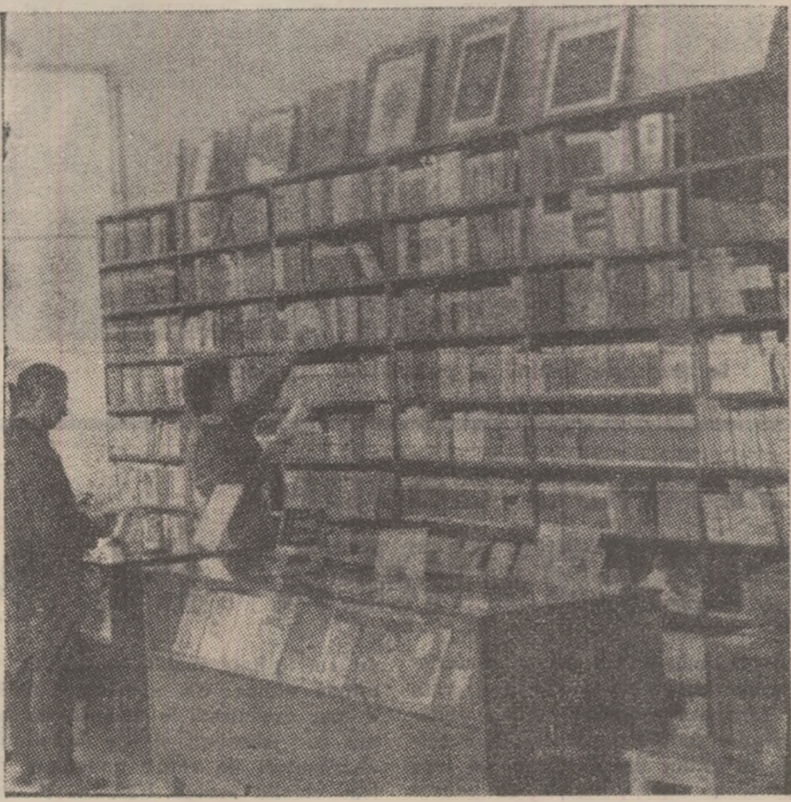
Într-o librărie nouă, dintr-un complex nou, situat în cel mai nou cartier al Petriței — 8 Martie.