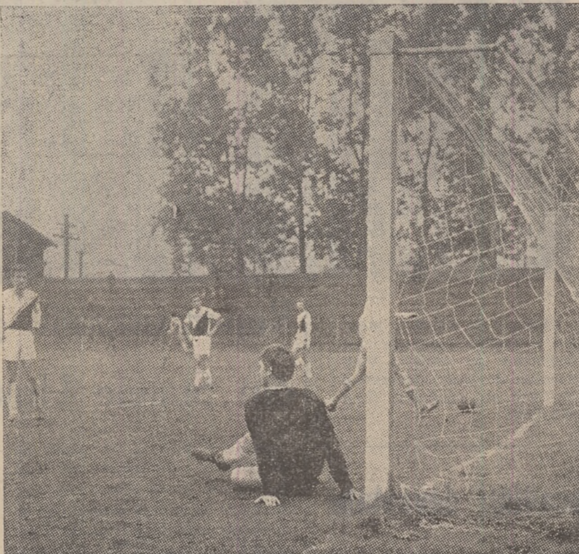
Mîngea poposește pentru a patra oară în poarta lui Sicla. 4-0 pentru Minerul.

2-0 și numai automulțumirea i-a făcut să plece doar cu un punct de pe malul mării. Cîteva cuvinte despre meciul de la poalele Timpei, unde Jiul a primit trei goluri în 25 de minute, dar a redus din handicap și puțin a lipsit ca tînărul Coleac, autorul celor două goluri (inspirat și introducerea lui în prima echipă), să nu egaleze situația. Cu această a treia înfrîngere consecutivă, Jiul a coborît pe locul 9, la egalitate de puncte cu Farul și Rapid, dar cu golaveraj negativ, de minus 2. De aceea, meciul de duminică al Jiului, cu Dinamo Bacău, trebuie privit cu toată seriozitatea, fiind așteptat cu multă nerăbdare de iubitorii fotbalului din Valea Jiului. Meciul Rapid — Dinamo București a fost amînat deoarece giuleștenii au venit cu Infiriere din turneul efectuat în Algeria.