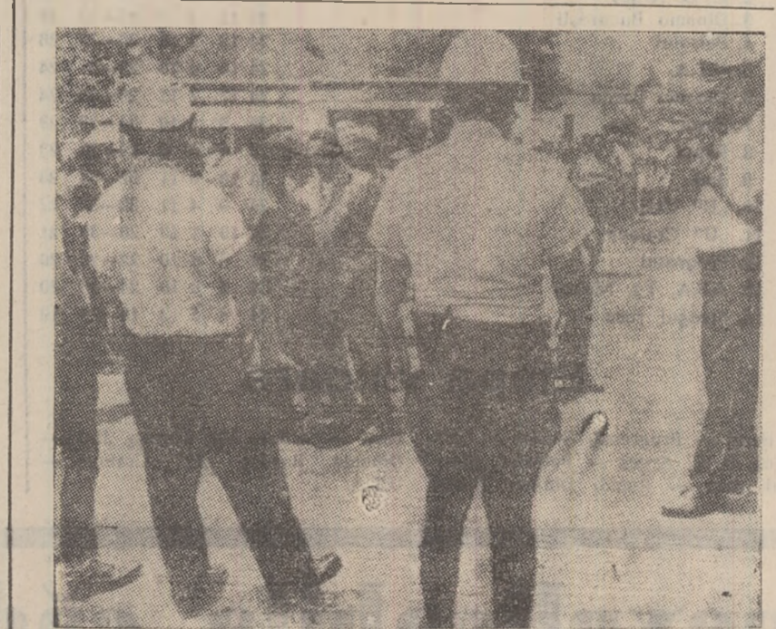
S.U.A.: În drum spre Washington, coloana participanților la „Marșul săracilor” străbat orașul Montgomery.

SAN FRANCISCO. — „Cinci gloanțe în cap și trăiește”. Acesta nu este titlul unui film de sci-fi ci buletinul medical al unui colajean american în vîrstă de 57 de ani originar din Alaska. În timpul unei vizite la San Francisco, el a fost atacat de cîteva persoane și aruncat de pămînt. Nu și-a dat seama de nimic decît în momentul în care „s-a trezit” și a chemat un taxi să-l ducă la hotel. La insistențele directorului hotelului, s-a prezentat la un medic. În urma unui examen radiologic s-a constatat că un glonț este implantat în lobul drept al creierului, alături de baza craniului, un al treilea în palat, iar al cincilea, care a pătruns pe sub ochiul stîng, se află între vena jugulară și artera carotidă.