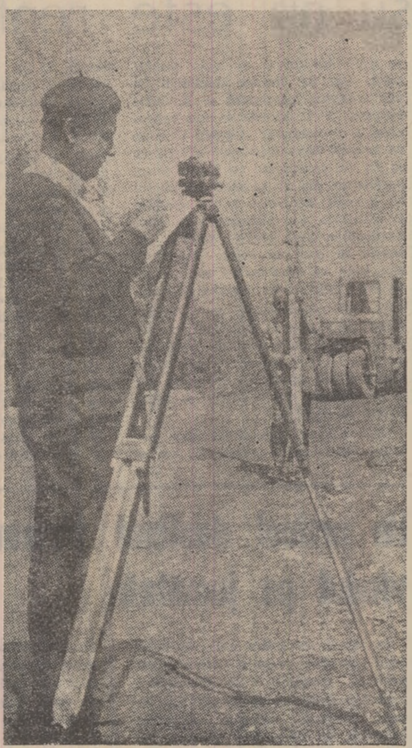
Topograful lu lucr. Se fixează terasamentul viitoareii căi ferate care urcă să se lege noua lină Livezeni de gară.