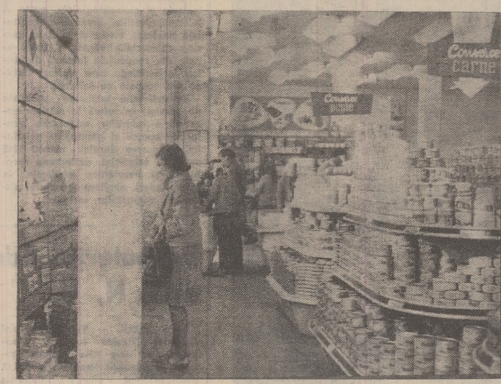
Aspect din magazinul cu autoservire din cartierul Livezeni — Petroșani.

Despre acest film, coproducție anglo-americană, cunoscutul și mult îndrăgitul actor Kirk Douglas spune: „Este vorba de o aventură care exaltă curajul și, sub acest unghi, filmul lui Mann este îndreptat în întregime împotriva monstruoasei conspirații naziste.” „Anul 1942. În Norvegia, ocupată de nazisti, exista ascuns în munți, o uzină hidroelectrică unde se producea apă grea, materie primă pentru fabricarea armelor nucleare. Acest produs prețios, care le-ar fi permis nemților să abiză primul bomba atomică, nu se fabrica decît aici, în Norvegia, în districtul Telemark. Filmul natează întîmplările prin care trece un grup de partizani, pentru distrugerea acestui produs.