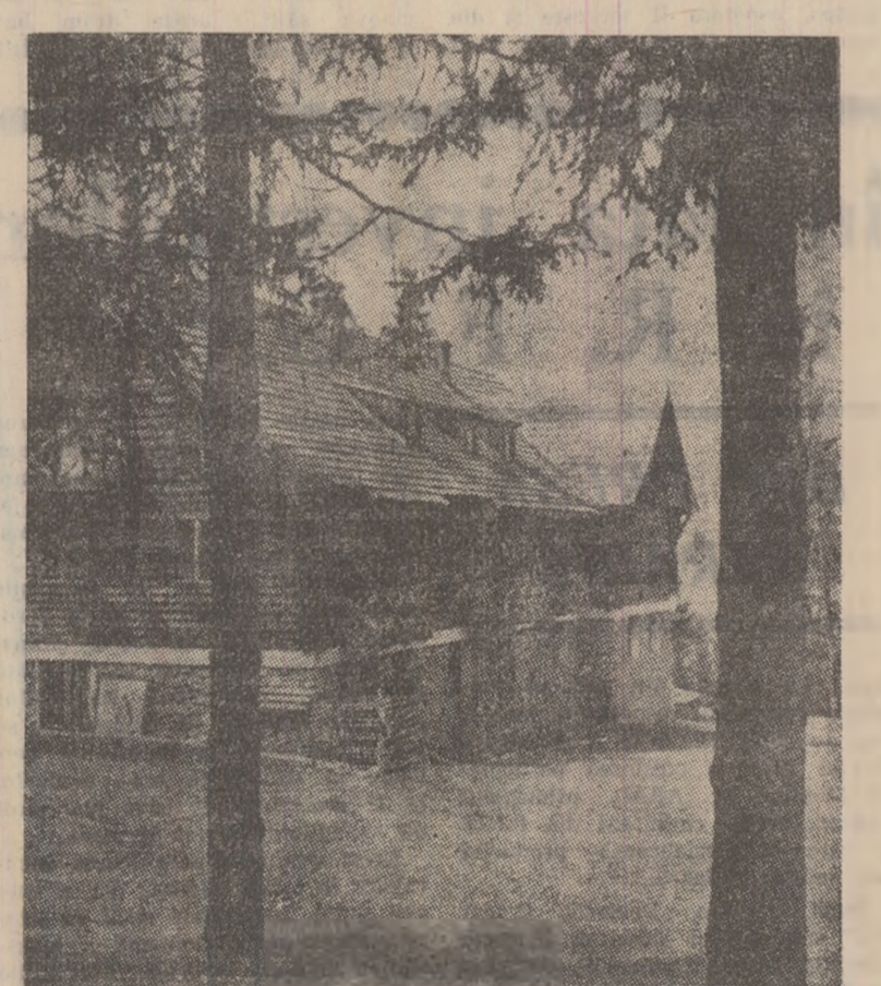
Pitoreasca cabană din Cîmpu lui Neag.