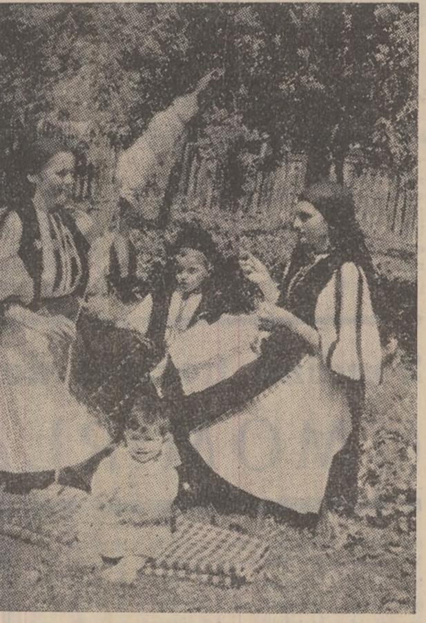
Sezătoare în familie, la Clmpa.

e, vor zice cel din Petroșani. De acor cu dinșii avînd în vedere acei populari „Calea-dulciurii”. Cei din Lupeni, însă, sînt de-a dreptul revolțaiți. De ani de zile, cele două aparate pentru calea filtru „zac” în cofetăriele din oraș fără ca cineva să încerce să le dea viață. Nepăsare e puțin spus. Cu atare noi, cei care ne lăcăm cafelele acasă, apelăm la serviciile magazinelor ce vînd cafea boabe, sau măcinată pe loc. Aici unii vînzători cîntăresc înții punga goală a cărei greutate o scad apoi din cantitatea de cafea cerută de noi. Alții, mai puțin „cumsecade”, trec peste acest amănunt. Azi așa, mine așa, și vorba aceea: dintr-un bob iese o mie... Pe de altă parte, cafeaua este uneori insuficient prăjită. Acest amănunt ne cam dă de gînd, pentru că odată fiartă, capătă culoarea de cea de... mușel și are un gust de lasole, pierzîndu-și aroma specifică. Din pușinul pe care-l cînușc în problema persajului, știu că s-a iadut o mică modificare a coeficientului de scăzămînt la prăjire, trecîndu-se de la 17,5 la sută la 15,97. Acest lucru probabil nu le prea convine unor anume vînzători și atunci uneori o lasă mai... moale, adică mai nepărită ca să tragă mai tare la cîntar... Ităd deci că, pornind de la o cafea, căreia i-am îndepărtat cainacul, am descoperit unele lucruri nu tocmai plăcute. Căteșii și vînzătorii ar trebui să gîncească în calea lucruri mai demne de domeniul în care își deslășoară activitatea și căruia i se spune comerț socialist. Nicu POPA