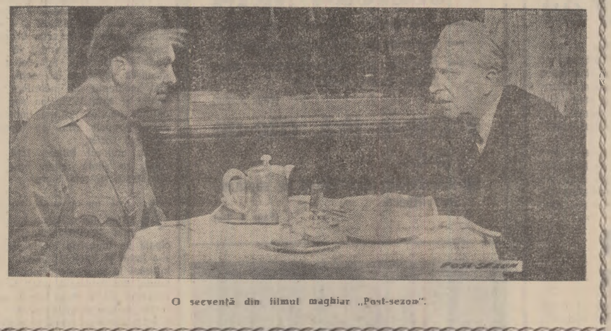
O scenetă din filmul maghiar „Post-sezon”.

niștii clienți ai bufetului gării, un grup de bătrîni pensionari, se plictisesc. Pentru a se amuza, născocesc o farasă: unul din pensionari, schimbîndu-și vocea, va trebui să dea telefon farmacistului pensionar Kerekcs și, din-în-se drept comandantul mîlției, să-l convoace la sediul mîlției, fără nici o explicație. De-acei începe drama eroului, pe care comunicarea din presă în legătură cu procesul Eichmann îl răsculiseră în ultimele zile de-ajuns ca să creadă că miliția îl convoacă pentru o veche și tînuță vină. Urmează povestea propriu-zisă a filmului, un celestocsc alcătuit din amintiri, evocări — un amestec de real și închipuire.