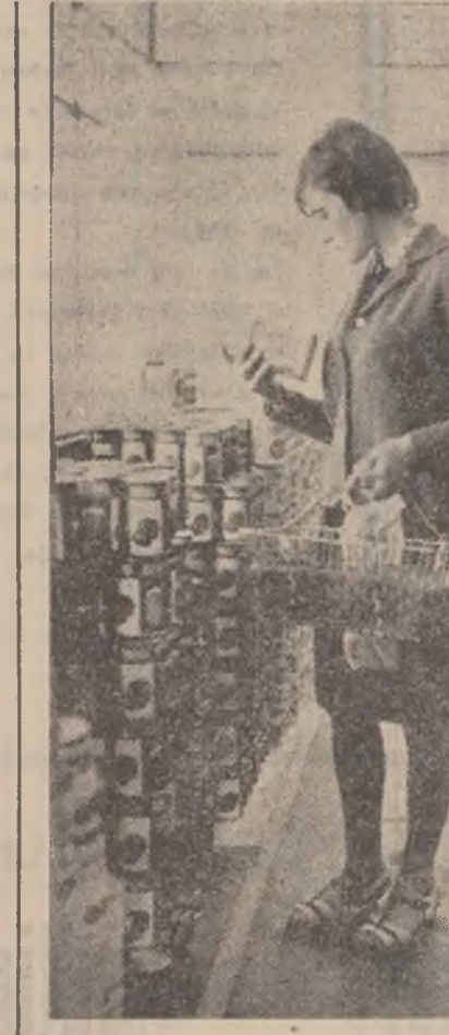
Bine aprovizionat, cu mărfurile expuse plăcut, magazinul alimentar cu autoservire din complexul Aeroport Petroșani atrage tot mai mulți cumpărători.