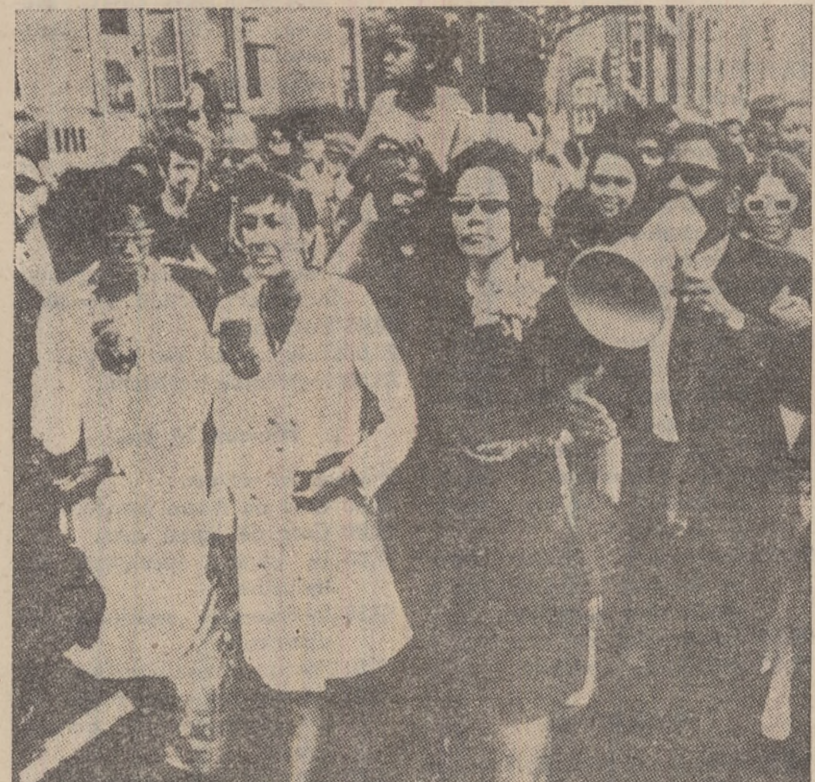
S.U.A. „Marșul săracilor” — impunătoare manifestație pentru drepturi civile și o viață așezată pe temeiuri egale ale populației albe. IN CLISEU: În primele rânduri ale demonstrațiilor se află soția victimei asasinatului de la Memphis — dna. Luther King.

Un buletin medical al aceluiași spital care se referă la starea sănătății pacientului Claire Thomas, căruia la 3 mai i-a fost grețată inima, arată că acesta face plimbări prin cameră și a trecut la alimentația normală.