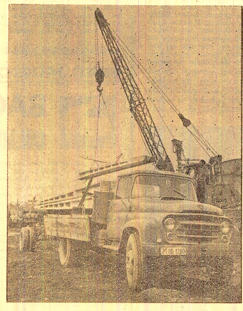
La Livezeni se încarcă stîlpi de beton pentru o nouă linie electrică.

Cu siguranță mulți dintre dumneavoastră trăiesc sentimente de satisfacție în legătură cu roadele strădaniilor gospodărești care și-au pus pecetea în această primăvară pe fizionomia orașului. Cu concurșul „direct al primăverii”, cu concursul oamenilor, Petroșaniul a înflorit. Covorele multicolore din parcuri, peluzele cu flori și verdețea, ce mărginesc artera principală,