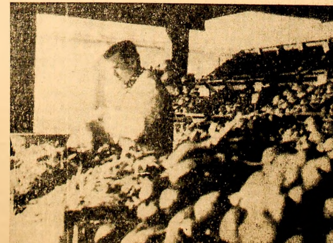
Una din expozițiile organizate de C.L.F. de „Ziua recoltei” în piața din Petroșani.