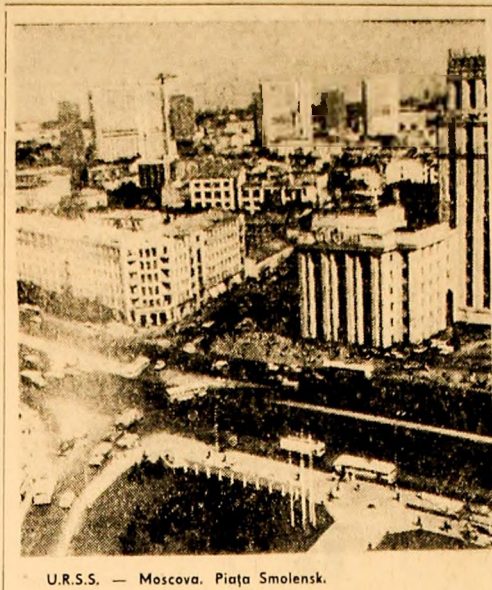
U.R.S.S. — Moscova. Piața Smolenski.