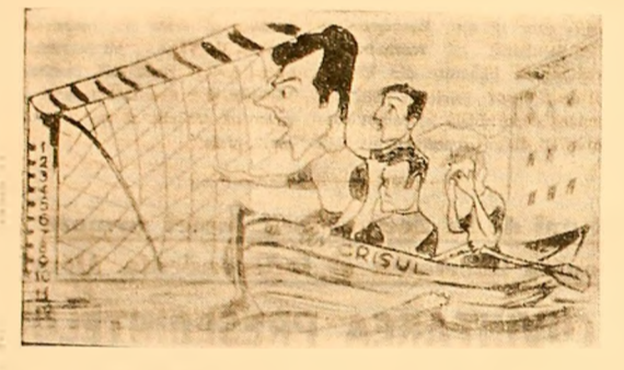
CRISUL VINE REPEDE, SCORUL VA FI ALB SAU NEGRU?...