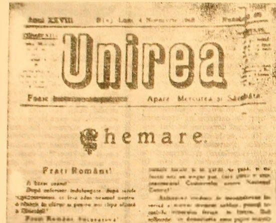
Numărul 68 al ziarului „Unirea” din Blaj în care a fost publicată Chemarea Comitetului Național Român pentru Unire.