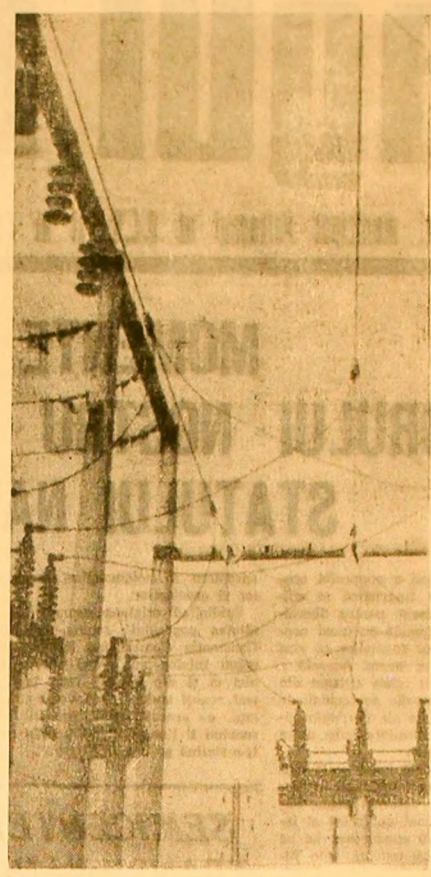
Arlere aeriene de energie electrică