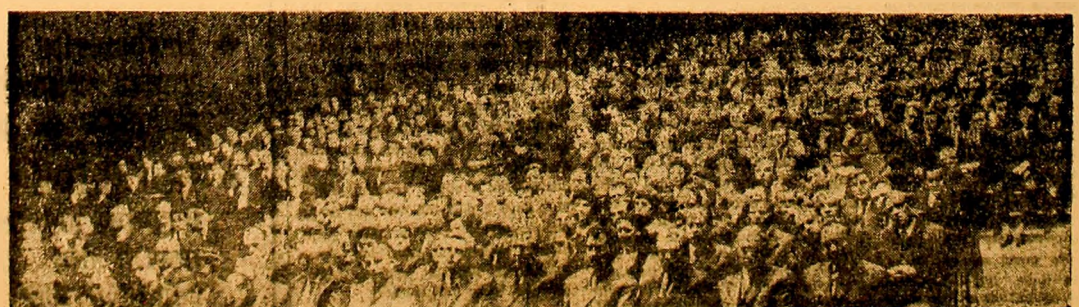
Aspect din sală, în timpul lucrărilor conferinței.