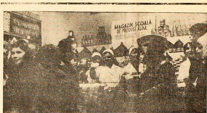
Acolo unde se învață buna deservire — în „magazinul” intern al Școlii profesionale comerciale.