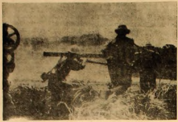
Patrioți sud-vietnamezi din regiunea Quang Tri în timpul unor pregătiri în vederea acțiunilor de luptă.