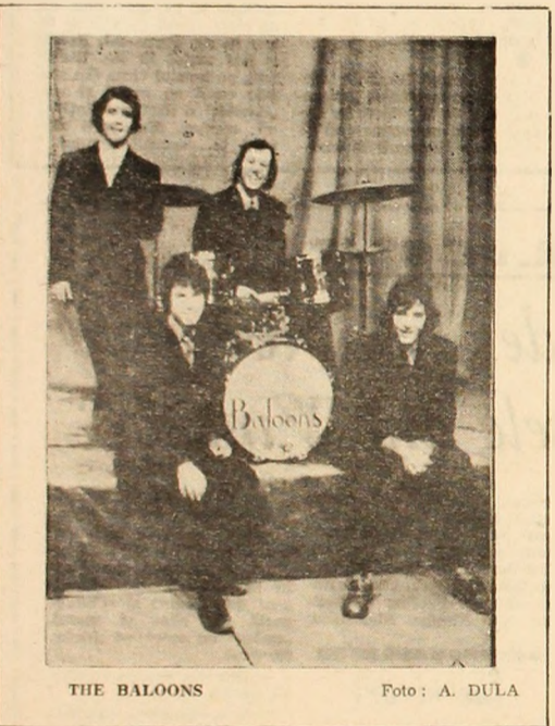
THE BALOONS

Cel mai înalt copac din lume este sequoia, veșnic verde, care crește în America de Nord. Trunchiul său ajunge pînă la 140 metri înălțime și 9 metri grosime.