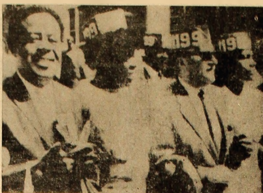
S.U.A.: Pastorul David Abernathy, liderul oamenilor de culoare, și-a petrecut noaptea la închisoare, pentru că a participat la un marș al greviștilor de la spitalul din Charleston 1968.

Comunicatul militar, citat de postul de radio Beirut, a făcut cunoscut de asemenea că lupte violente între militarii libanezi și membri ai grupului „Al Saika” se desfășoară în regiunea Kabr Mikha (la 10 km de frontiera cu Israelul) și Markabet Talloussa (la 25 km sud-vest de Hasbaya). Potrivit aceluiași sursă, în cursul ciocnirilor un soldat libanez și un membru al grupului advers au fost uciși. Mai mulți membri ai grupului „Al Saika” au fost arestați.