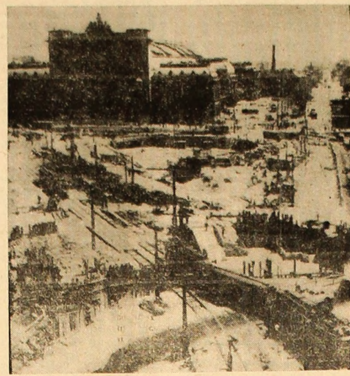
R. P. UNGARA: La Budapesta este în construcție noul sistem de trafic pe șine, în Piața Haros și pasajul subteran care leagă strada Rakoczi de Piața Haros. ÎN CLIȘEU Lucrările de suprafață.

În noaptea de joi spre vineri, unitățile F.N.E. au bombardat cu rachete și mortiere peste 100 de obiective americane-saigonice, situate în special în regiunea capitalei. S-a dețasat ca intensitate atacul efectuat asupra bazei aeriene de la Dien Hoa (cea mai importantă de pe teritoriul sud-vietnamez), situată la 24 km nord de Saigon. Au fost, de asemenea, in-