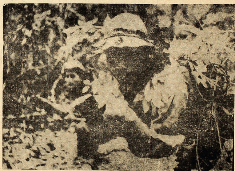
Ostași ai Frontului Național de Eliberare din Vietnamul de sud în timpul unui atac asupra bazelor militare inamice pe Platourile Inalte.

SAIGON 12 (Agerpres). — În cursul nopții de miercuri spre joi, artileria forțelor Frontului Național de Eliberare din Vietnamul de sud a bombardat 23 de poziții fortificate ale trupelor americano-saigoneze — informează corespondentul agenției France Presse. Un purtător de cuvînt militar american a semnalat ca „importante” 13 din acțiunile ofensive inițiate de F.N.E. ținînd seama de daunele cauzate de acestea forțelor S.U.A. și ale administrației saigoneze. Baza logistică a pușcilor marine americane de la Da Nang a fost una dintre principalele ținte ale atacurilor declanșate de patrioți. După cum s-a anunțat, sectorul Da Nang a fost de mai multe ori, în cursul acestei săptămîni, scena unor ciocniri violente între detașamentele F.N.E. și trupele americane. Instalațiile militare deținute de trupele saigoneze în apropiere de Vinh Long și în regiunea Quang Duc au fost supuse, de asemenea, unui intens bombardament de către forțele F.N.E.