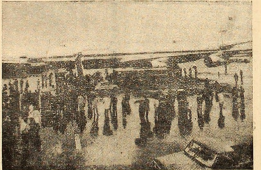
FRANȚA: Avionul american gigant „Boeing 747” care poate transporta 400 pasageri, prezentat la Salonul Internațional de la Bourget. Pentru a i se scoale în evidență mărimea a fost așezat alături de un autobuz. La stînga se vede „Concorde 001”.

SAIGON 18 (Agerpres) — În vînturile 24 de ore, bombardierile americane „B-52” au efectuat mai multe raiduri în provincia Tay Ninh, la nord-est de Saigon, în sectorul Kontum și în zona platourilor înalte din Vietnamul de sud. Importanța buză aeriană a forțelor americano-saigoneze de la Bien Hoa, situată la 30 kilometri de capitala sud-vietnameză, a fost din nou atacată de forțele patriotice în cursul nopții de marți spre miercuri. Unități ale Frontului Național de Eliberare din Vietnamul de sud au bombardat pozițiile deținute de forțele inamice în orașul An Loc, capitala provinciei Binh Long. Cartierul general al unei brigăzi de parașutiști americani din provincia Binh Dinh a fost, de asemenea, atacat de grupuri de patrioți. Correspondenții agențiilor de presă relatează, totodată, că tabăra specială a forțelor S.U.A. amplasată la Ben Het, în zona platourilor înalte, a fost bombardată de artileria F.N.E. pentru a fi consecutiv. Potrivit declarațiilor unui purtător de cuvânt saigonez, peste 20 de poziții ale forțelor americane și saigoneze au fost ținte ale atacurilor inițiate în cursul nopții de marți spre miercuri de unitățile F.N.E.