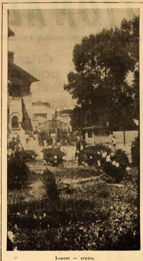
Lupeni - centru.

Minerii Văii Jiului își exprimă totala aderență față de prevederile documentelor care vor fi supuse dezbaterilor Congresului al X-lea al partidului pentru că drumul indicat de partid răspunde in cel mai înalt grad aspirațiilor de bunăstare, libertate și fericire ale întregului nostru popor, pentru că numai calea de dezvoltare propusă de partid asigură lichidarea rămănișii în urmă față de țările cu economie avansată, crează condiții favorabile pentru utilizarea superioară a resurselor materiale și umane ale țării. Aderența noastră plină față de politica partidului, de ridicare a României socialiste pe o treaptă superioară de dezvoltare va trebui să se concretizeze prin îndeplinirea exemplară a sarcinilor ce ne revin, de creștere a productiei de carbune, a productivității muncii și a eficientei economice.