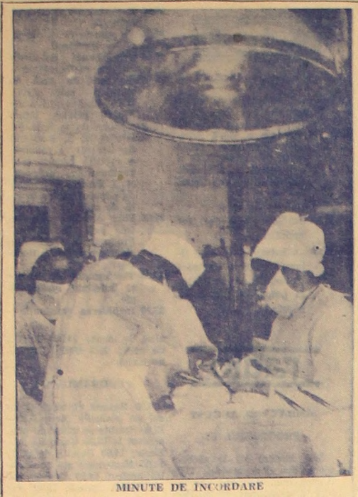
MINUTE DE INCORDARE

Devenea un obicei să-mi scrieți... Dar unde erati cu 25 de ani în urmă? ... Dar unde erati cu 25 de ani în urmă?