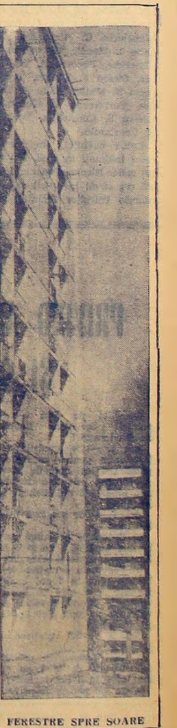
FERESTRE SPIRE SOARE