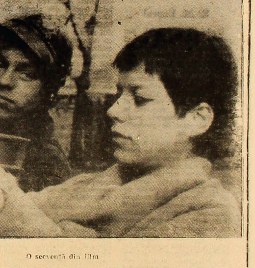
O scenă din film