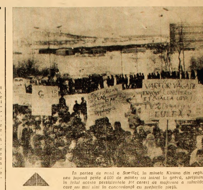
In partea de nord a Suediei, în minele Kiruna din regiunea laptonă peste 4000 de mineri au intrat în grevă...