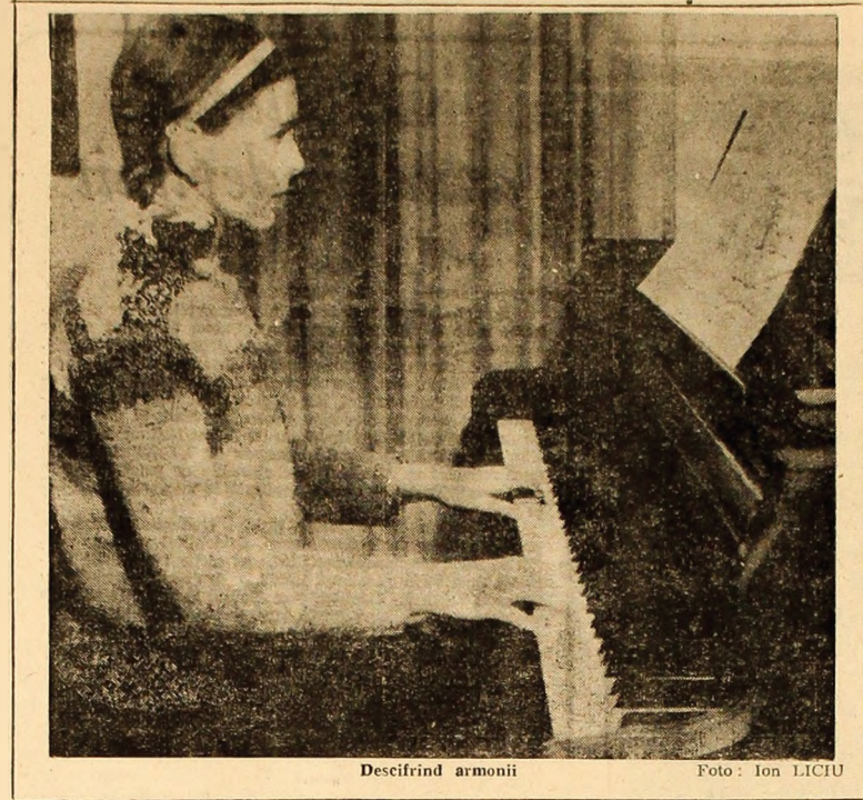
Descifrînd armonii

— E adevărat, preopinutul nostru are dreptate în multe din afirmațiile sale. Problema nu poate fi privită însă unilateral. Să afirmăm că teatrul local nu realizează de cele mai multe ori spectacole de valoare, înseamnă să nu cunoaștem adevărata stare a lucrurilor. Situația nu se pare mult mai complexă și ea trebuie privită în ansamblu. Fenomenul scăderii numărului de spectatori nu afectează doar teatrul din Petroșani, ci majoritatea teatrelor din țară, și am putea afirma, fără să exagerăm, din Europa. Faptul e simptomatic și preocupă nu numai pe oamenii de teatru dar și pe sociologi. E de ajuns să arătăm, în această ordine de idei, că problema publicului de teatru a făcut obiectul ultimului număr al revistei „Teatrul”, în coloanele căreia și-au dat întîlnire actori, regizori, dramaturgi, publiciști, sociologi etc., căuțînd să elucideze diversele fațete ale acestei realități. Așadar teatrul din Petroșani nu constituie o excepție, ceea ce nu ne împiedică însă să căuțăm să vedem ce se mai poate face în această direcție pe plan local.