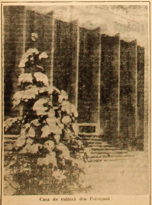
Casa de cultură din Petroșani

— „Ca să fii la zi, trebuie să citești și noaptea” TUDOR MUȘATESCU