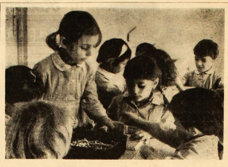
Una fie, alta mie...