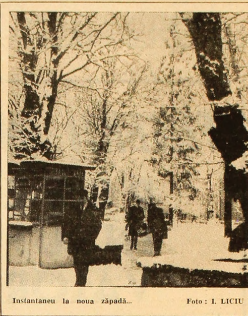
Instantaneu la noua zăpadă...

Toți cei care dețin asemenea mărfuri, precum și diferite obiecte care au fost folosite de organele de stat, organizațiile obștești sau persoane care au participat la aceste acțiuni revoluționare (drapete, pancarte, ștampile, legitimații, carnete, insigne, broșuri, obiecte personale