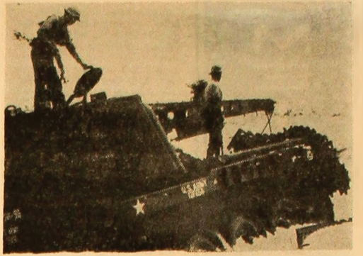
Forțele armate de eliberare au capturat un tanc inamic, după ce l-au șos din luptă la nord de Quang Tr.

SAIGON 13 (Agerpres) — În urma luptelor angajate cu forțele patriotice sud-vietnameze, trupele americane au pierdut, în cursul ultimei săptămâni 95 de militari. În aceeași perioadă, din par-