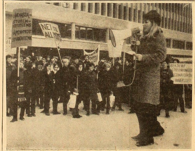
Sute de studenți au demonstrat pe distanță dintre Universitate și Ministerul Invățământului din Oslo, în deplină liniște, cu pancarte împotriva majorării taxelor de învățământ.

În Franța, zăpada abundentă și poleiul au perturbat serios circulația pe căile de acces spre Paris. Rafalele de zăpadă au redus foarte mult vizibilitatea pe șosele. Pe de altă parte, după ploile torențiale din ultimele zile, nivelul apelor râurilor a crescut deosebit de mult. Marna a ieșit din albia, obligînd locuitorii a zece comune riverane să se deplaseze numai cu ajutorul bărcilor. Și cotele Senei continuă să crească; joi dimineață ele înregistrau 3,40 metri și se așteaptă să ajungă chiar la 4,30 metri. În Alpi, zăpada cade din abundență făcînd ca circulația să devină din ce în ce mai dificilă pe căile de acces spre stațiunile turistice montane. Intre Chamonix și Armentieres drumul a fost complet barat de zăpadă.