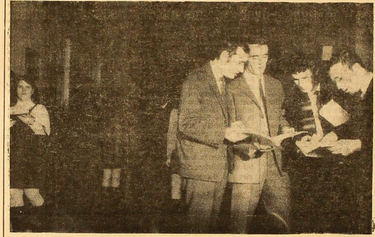
Emoții înaintea examenului de aeraj și protecția muncii

Evident, la realizarea celor trei milioane de tone de otel vor contribui și colectivele otelăriei Martin nr. 1 și otelăriei electrice. Un sin-