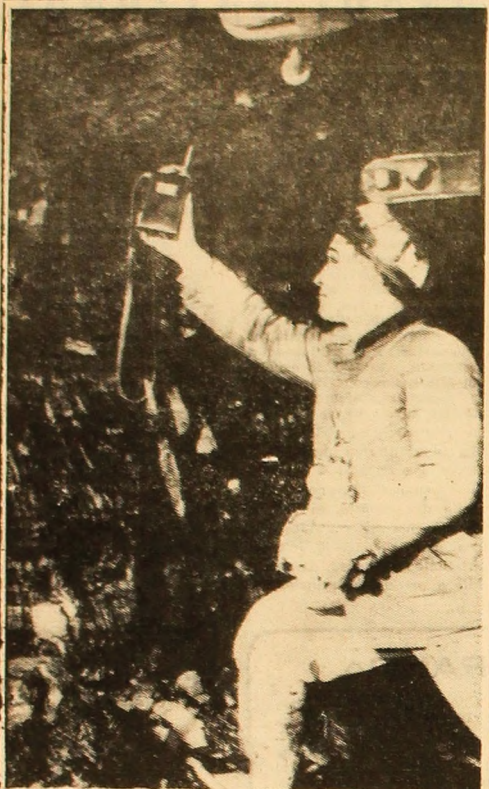
La mina Lupeni. Se efectuează controlul gazului metan

nu! controlului din decembrie anul trecut, spre exemplu, efectuat de directorul E.D.M.N., nu l-a trecut cu succes. Erau pe undeva niște nereguli pedo-rite. Rezultatul — o sancționare cu „observație”. Cam după