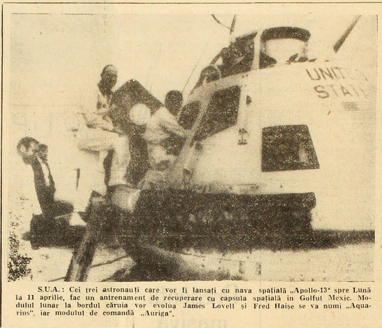
S.U.A.: Cei trei astronauți care vor fi lansați cu nava spațială „Apollo-13” spre Lună la 11 aprilie, fac un antrenament de recuperare cu capsula spațială în Golful Mexic. Modulul lăraie bordul căruia vor evolua James Lovell și Fred Haise se va numi „Aquarius”, iar modulul de comandă „Auriga”.

În primele zece zile ale lunii martie, detașamente ale Guvernului Revoluționar Provizoriu al Republicii Vietnamului de sud, care acționează în provincia Long Binh, au întreprins 29 de atacuri asupra unor tabere militare ale inamicului. În urma acestor acțiuni ofensive, menționează agenția citată, 400 de militari inamici au fost uciși, dintre care 282 australieni, iar 24 de tancuri distruse. În aceeași perioadă, trupele americano-saigoneze au pierdut în Delta Mekongului aproximativ 1200 de soldați și ofițeri, patru elicoptere și trei nave, conchide agenția Eliberarea.