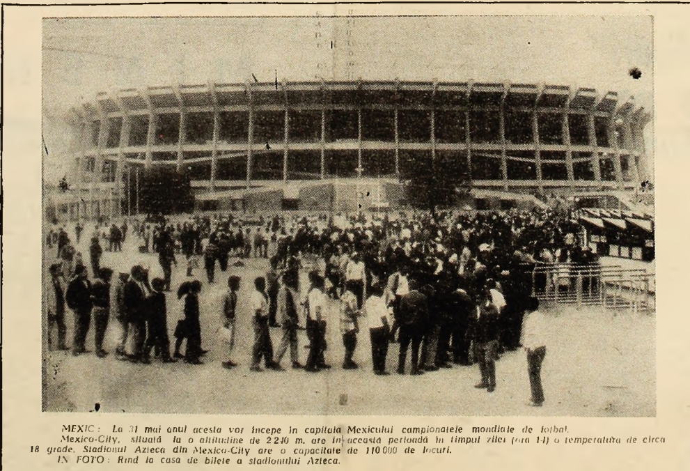
MEXIC: La 31 mai anul acesta vor începe în capitală Mexicului campionatele mondiale de fotbal. Mexico-City, situat la o altitudine de 2240 m. are în această perioadă în timpul zilei (ora 14) o temperatură de circa 18 grade. Stadionul Azteca din Mexico-City are o capacitate de 110.000 de locuri. IN FOTO: Rînd la casa de bilete a stadionului Azteca.

RIO DE JANEIRO 13 (Agerpres). — Poliția braziliană a luat noi măsuri pentru împușcarea campaniei împotriva „Escadronului morții“, o organizație clandestină formată din fosta poliție, care a asasinat sute de persoane majoritatea lor scăpate de sub urmărirea judiciară. Au fost lansate apeluri către populație în vederea adunării de probe și mărturii asupra activității criminale a membrilor acestei organizații. Noile măsuri sînt o urmare directă a demasării, de către un anume Jonas Silveira, a fostului locotenent de poliție João Coelho da Silva ca unul din cei trei membri ai „Escadronului morții“ care au încercat să-l asasinaze săptămîna trecută. Acesta din urmă a și fost arestat și supus interogatoriilor. Guvernatorul statului Rio de Janeiro, Jeremias Pontes, a convocat de urgență pe principalii membri ai comisiei de anchetă și a hotărît ca urmărirea membrilor „Escadronului morții“ să fie extinsă și în localitățile invadate inclusiv în orașul Rio de Janeiro, care aparține de statul Guanabara. Se apreciază că, în ultimele 10 luni, membrii acestei organizații au ucis aproximativ 500 de persoane. Președintele comisiei de anchetă, inspectorul Horacio Gomez, a cărui locuință este pîzită în permanență, a fost împușcat și reținut orice persoană suspectă și i s-a promis întregul sprijin din partea guvernului brazilian.