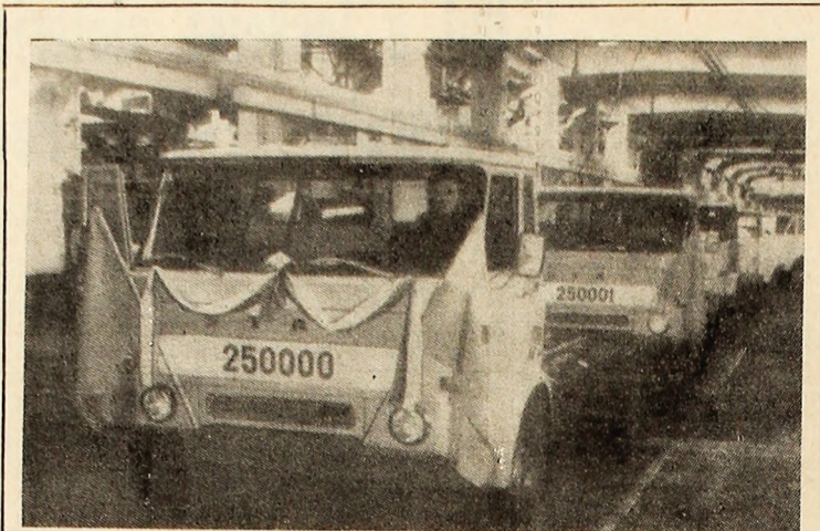
La Fabrica de autocamioane F.S.C. Lorry din Starachowice (R. P. Polonia) s-au realizat până acum 250.000 de camioane. Fabrica funcționează din 1948, când aici se fabricau autocamioane de 3 tone. Azi se fabrică de 5 tone, iar pentru anul 1971 sînt prevăzute camioane „Star 200” de cîte 6 tone. În foto: Cel de al 250.000-lea camion.

Vizita șefului statului turc în România a constituit o etapă nouă, remarcabilă în evoluția pozitivă a relațiilor româno-turce.