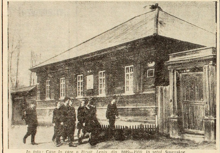
În foto: Casa în care a locuit Lenin din 1889-1900 în satul Sușenskoe.