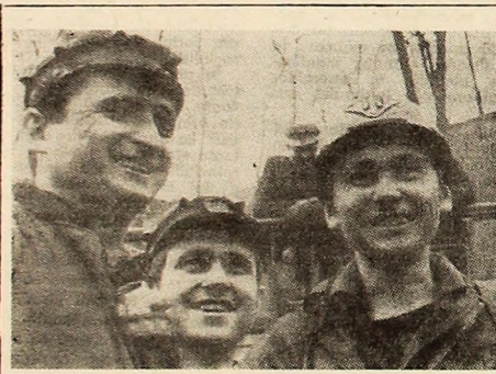
La o șuetă după șit

Iată asadar cîteva aspecte, care merită reflecții.