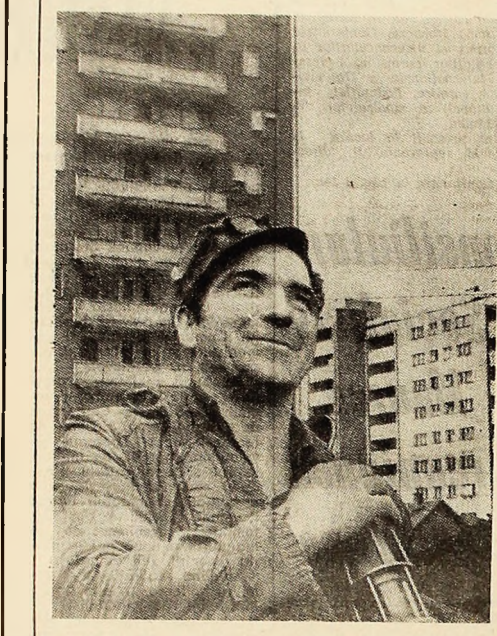
Spre casă cu datoria împlinită!