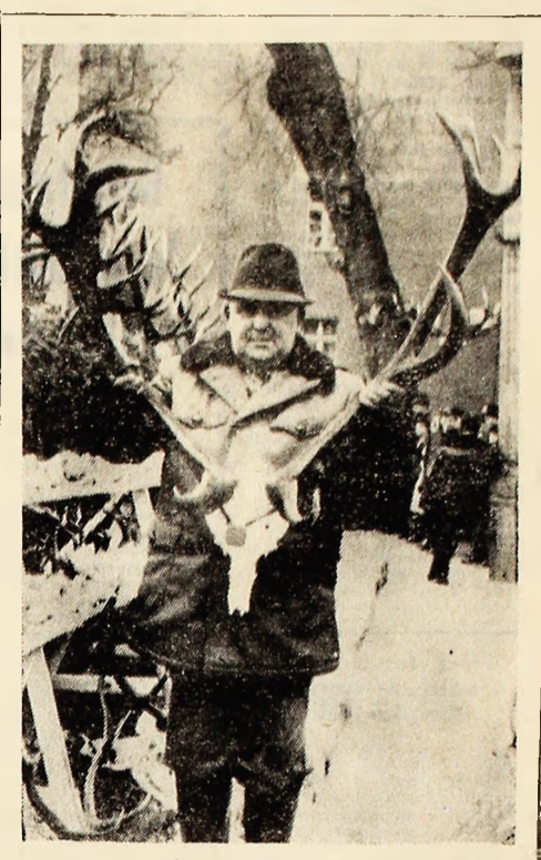
R. P. POLONIA: Începînd din mijlocul lunii aprilie, în fiecare sîmbătă, la Opole, capitala regiunii cu același nume, are loc „Festivalul Regiunii”, în care locuitorii expun realizările lor din ultimii 25 de ani. În foto: Trofee vinîterilor expuse de către locuitorii din Olesno Poviast, în Piața Plac Wolnosoi din Opole.

● Comandantul suprem al forțelor armate sud-africane, generalul Himstra, a declarat că, în ultimii zece ani, Republica Sud-Africană a achiziționat armament în valoare de 980 milioane dolari, confirmînd în felul acesta anseerile din presa africană potrivit cărora regimul rasist de la Pretoria intensifică ritmul de sporire a forței sale armate.