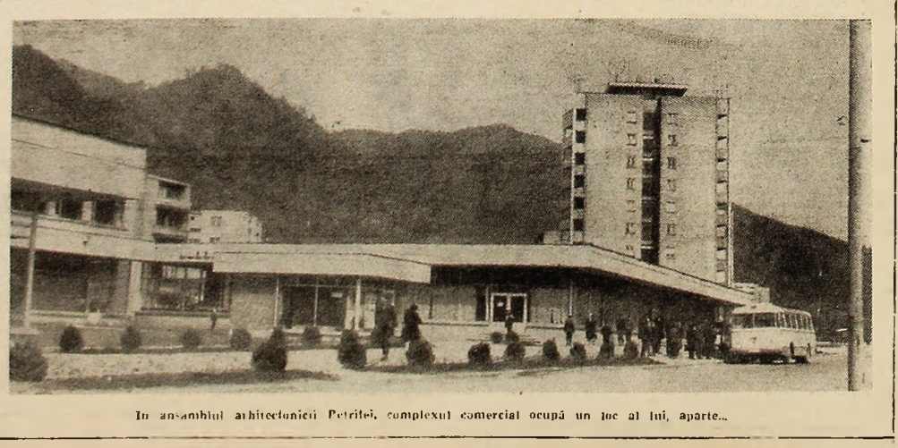
În ansamblul arhitectonic Petriței, complexul comercial ocupă un loc al lui, aparte...

fășurat o muncă mult mai ordonată, mai ritmică. Participarea la seminarii ca și nivelul acestora a crescut în special la anii unde cadrele didactice îndrumătoare au folosit procedee variate, completate cu acțiuni educative de conținut. La vederea asigurării unui studiu individual ritmic și susținut pe întreg parcursul semestrului, cadrele didactice din cadrul de Tehnică minieră generală, au organizat săptămînal inițieri cu grupele repartizate pentru coordonare, în care s-au discutat rezultatele lucrărilor de control, stadiile de întocmire a proiectelor, situația frevenței, pregătirea pentru sesiunea de examene etc. Pentru îmbunătățirea frecvenței, membrii cadrelor de Lucrări miniere și preparare au inițiat discuții individuale cu studenții (Continuare în pag. a 3-a)