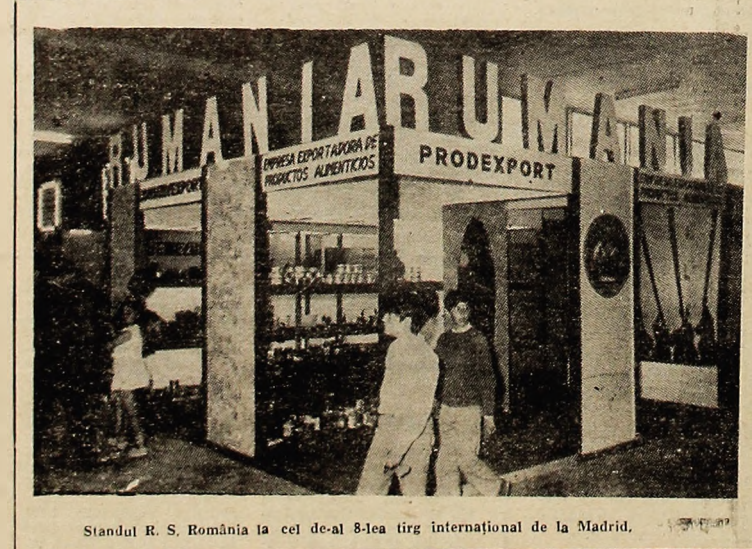
Standul R. S. România la cel de-al 8-lea tirg internațional de la Madrid.

Armată a 4-a braziliană, care a primit ordin să acorde ajutor sinistratilor, se străduiește să evacueze populația din zonele afectate de secetă și în același timp să împarta alimente celor înfometați.