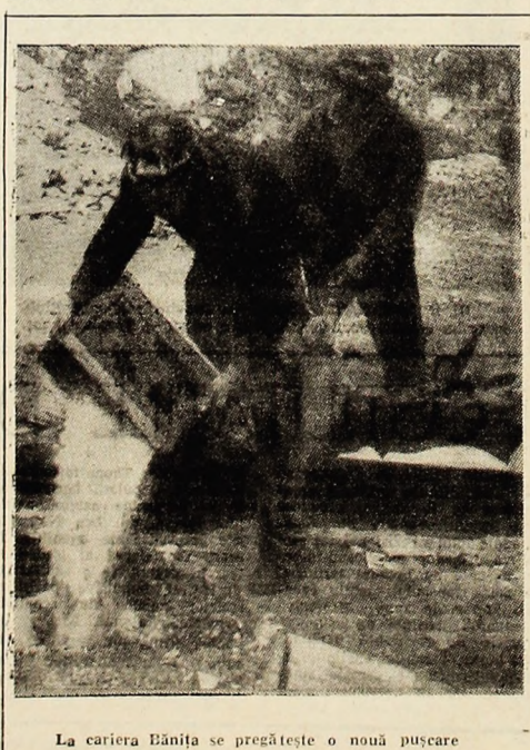
La cariera Bănița se pregătește o nouă pușcare