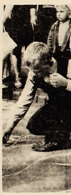
Cred că-mi va reuși „desenul“