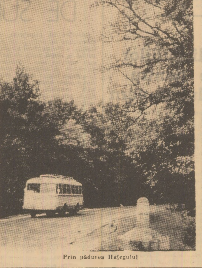
Prin pădurea Hategului