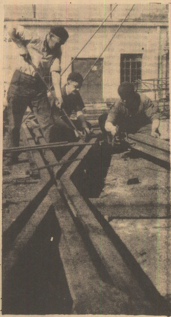
U.M.P. S. execută montarea unui macaz pentru mina Lonea.