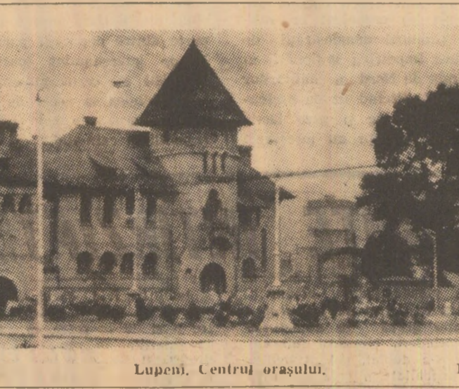
Lupeni. Centrul orașului.

PROGRAMUL 1: 5.05-6.00 Muzică dimineață; 6.05-9.30 Muzică și actualități; 7.00 Radiojurnal; 9.30 Atenție; 10.10 Curs de limba spaniolă; 10.30 Pagini albe din muzica de estradă; 11.05 Arii din opere; 11.30 De toate pentru toi; turștii; 11.45 Sfatul medicului; 12.00 Din muzica paparelor; 12.15 Orchestra de muzică ușoară a Radioteleviziunii; 12.25 Știința la zi; 12.30 Întîlnire cu melodia populară și interpretul preferat; 13.00 Radiojurnal; 13.10 Avangardă cotidiană; 13.22 Melodii de Gheorghe Ursescu și Ion Stăvăr; 13.45 Orchestra de muzică populară „Flacăra Prahovei” din Ploiești; 14.00 Calescop muzical; 14.40 Publicitate radio; 14.50 Cîntec bălărești; 15.00 Roza vînturilor; 15.25 Compozitorul săptămîni; 16.00 Radiojurnal; 16.20 Jocuri din Franca; 16.45 Muzică de programă; 17.05 Populare patrie; 17.35 Melodii populare; 18.00 Arii din opere; 18.10 Revista economică; 18.25 Melodii de pretutindeni; 19.00 Gazeta radio; 19.20 Slăgere; 19.30 Multă mîntuire inimă — cîntece populare; 20.05 Tabela de seară; 20.10 Muzică ușoară; 20.20 Arghiziana; 20.25 Zece melodii preferate; 21.00 Atențiune, părinte!; 21.20 Cîntă Julius la Rosa; 21.30 Moment poetic; 21.35 Solista scrii: Anda Călugăreanu; 22.00 Radiojurnal; 22.20 Sport; 22.30 Jazz; 23.00 Concert de muzică ușoară; 0.03-3.00 Estrada nocturnă.