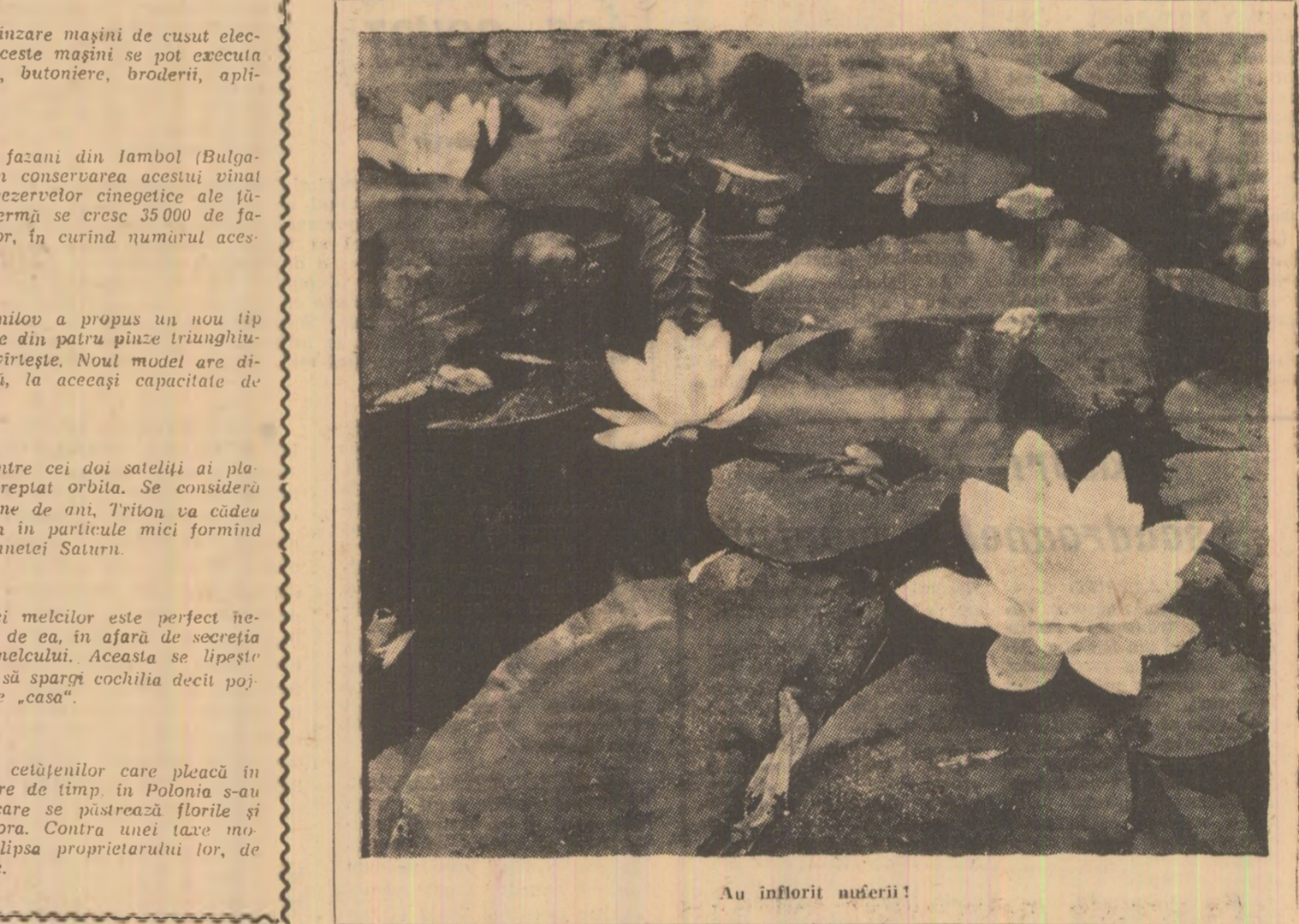
Au înflorit nușeri!

Noi posibilități de a cunoaște frumusețile patriei sînt oferite în această lună tinerilor din Valea Jiului, prin comisia de turism pentru tineret a Comitetului municipal al U.T.C. Astfel, în zilele de 8 și 9 august se organizează o excursie la Sibiu cu autocarul. Costul excursiei este de 95 lei. Inscriserile se primesc pînă în data de 7 august ora 17.