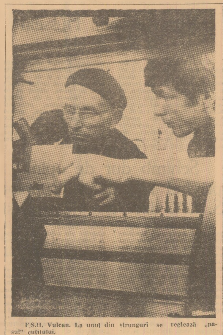
F.S.H. Vulcan. La unu din strunguri se retezază „păsul” cuțitului.

Cercetătorii secției electrosecuritate minieră din cadrul S.C.S.M. Petroșani au finalizat studiul „Determinarea potențialelor electrostatice la materialele utilizate în mină și stabilirea condițiilor pentru evitarea pericolului pe care îl prezintă electricitatea statică în mină”, contractat cu Centrul Cărbunelui cu termen de întocmire și precare la beneficiar la sfârșitul trimestrului III. Și acum citeva amănunte despre importanța studiului. Este cunoscut că masele plastice, datorită avantajelor pe care le prezintă, cîștigă din ce în ce mai mult teren privind folosirea lor în cele mai diverse ramuri ale industriei. Masele plastice au pătruns și în mină, iar în unele cazuri, grăzitoare unde nu pot fi admise cu ușurință din cauză că se încarcă electrostatic și ca urmare pot provoca aprinderea sau explozia amestecurilor de gaze explozive.