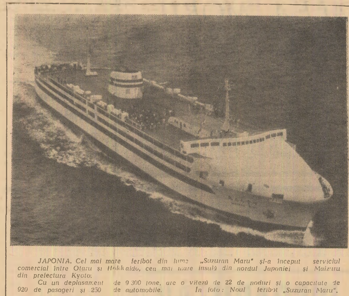
JAPONIA. Cel mai mare feribot din lume „Suzuran Maru” și-a început serviciul comercial între Ota și Hokkaido, cea mai mare insulă din nordul Japoniei și Miezuru din prefectura Kyoto.

Opiniile sînt împărțite în ce privește adevăratele scopuri ale lui Caetano. Unii dintre comentatori, referindu-se la primele măsuri luate după asumarea puterii, vorbesc despre o „liberalizare” sau „deschidere”, cînd în sprijinul afirmației lor libertatea pe care au avut-o candidații opoziției în alegerile din octombrie 1969, precum și subordonarea forței față de Ministerul de Interne a faimoasei poliții politice — PIDE. Alți observatori, dimpotrivă, afirmă că nimic nu s-a schimbat și apreciază așa-numita „liberalizare” drept o manevră politică care vizează liniștirea opoziției.