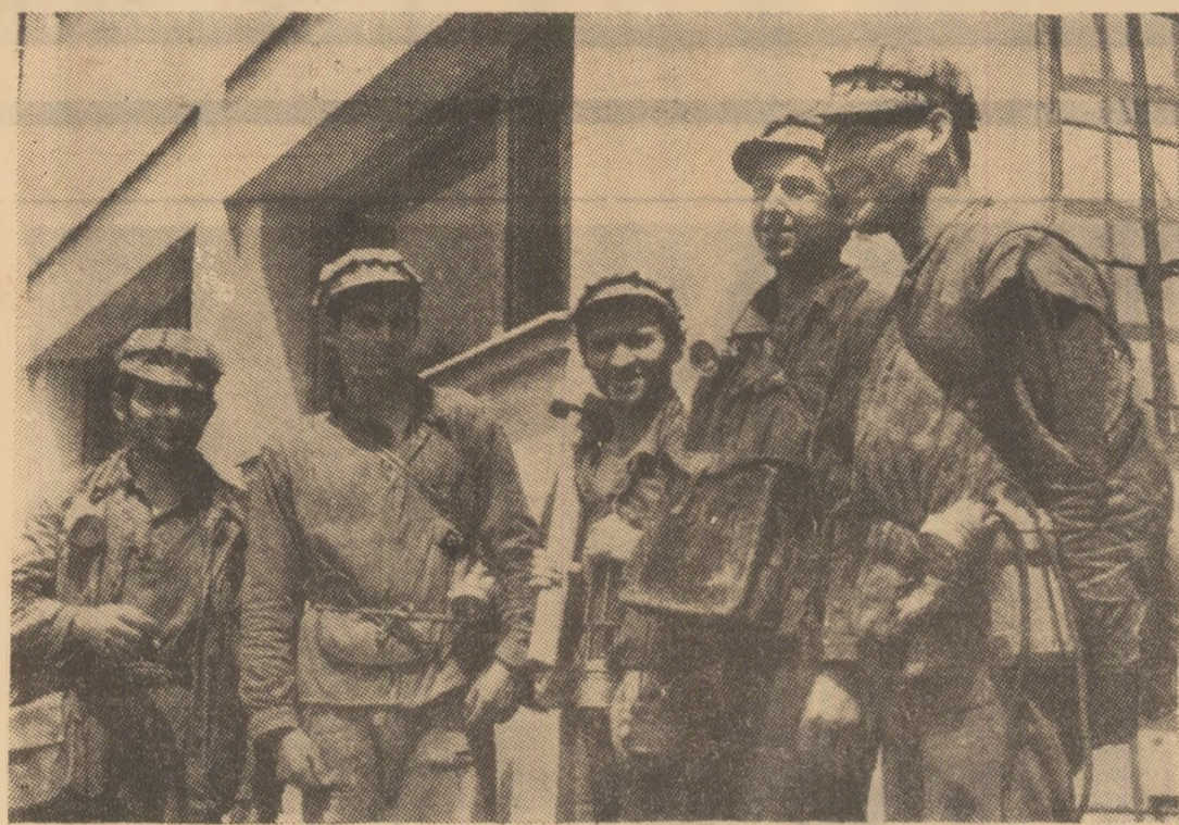
Un grup de mineri dijenii la țesura din șut