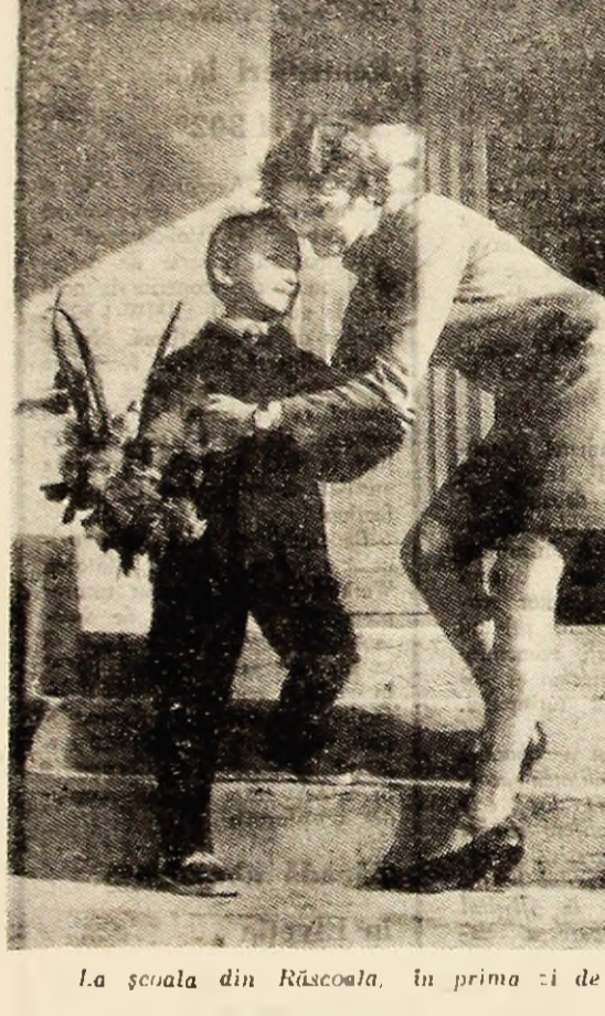
La școala din Răscova, în prima zi de școală