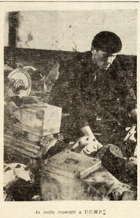
În secția reparării a U.U.M.P.

Telefoane: redactor șef - 1638; redactor șef adjunct și secretariat de redacție - 1662; secția ziarului, prin centrală - 1220 (1221); viața de partid - interior 71; socială - interior 74; economică - interior 53; cultură-invățământ - interior 41; administrație - interior 58; prin telefon carbunelui - 269. După ora 16, telefona de serviciu - 1663.