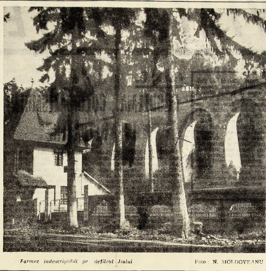
Farmeri indescrisibili pe defileul Jiului

Angajarea sau promovarea personalului pe funcții care au atribuții legate de gestionarea și