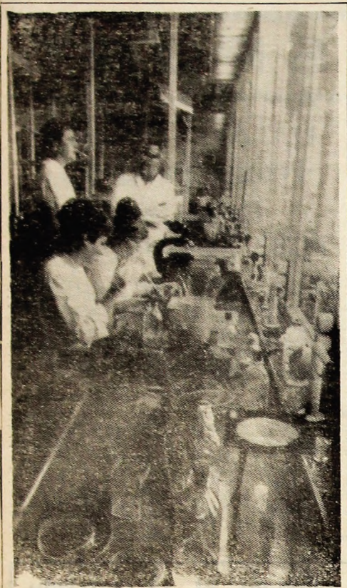
R. D. GERMANĂ: Secția experimentală a Institutului de cercetări cancerigene de la Academia de Științe din Berlin, este cunoscută în străinătate pentru cercetările întreprinse în domeniul virusurilor cancerului. În foto: Vedere de ansamblu a unui din laboratoarele secției de cultură a virusului pe țesuturi umane. După metoda lui, țesuturile păstrate în cutii și alimentate artificial, sînt studiate cu ajutorul animalelor experimentale și a microscopului electronic, pentru depistarea virusului în celulele cancerose.