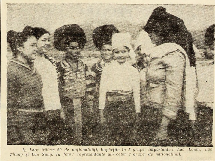
În Laos trăiesc 60 de naționalități, împărțite în 3 grupe importante: Lao Loum, Lao Thung și Lao Sung. În foto: reprezentanți ale celor 3 grupe de naționalități.