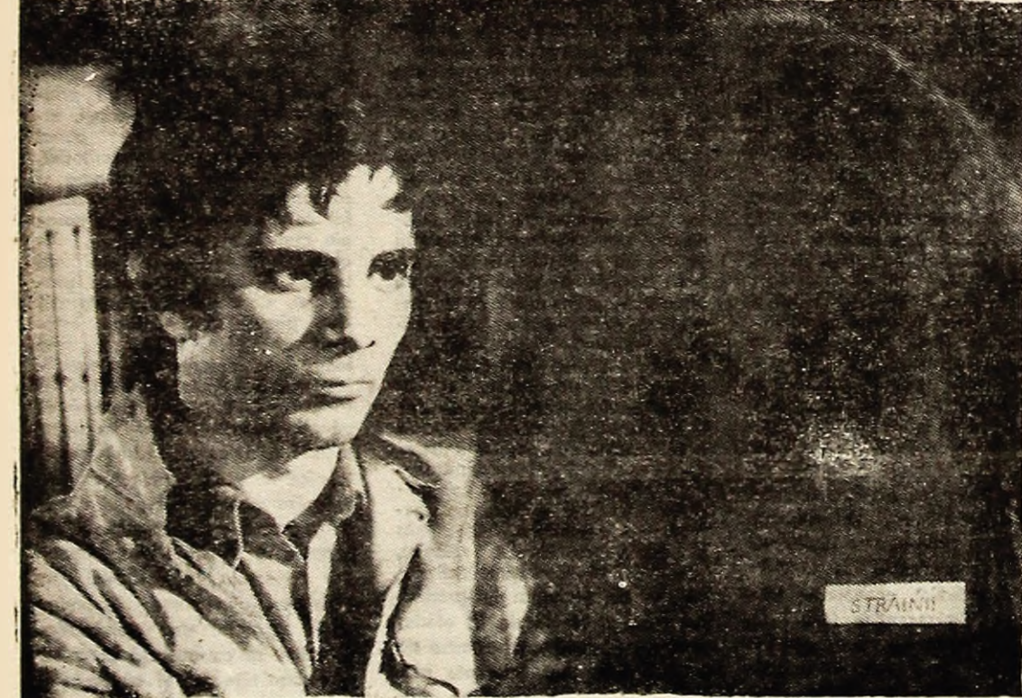
„Străinu” este un film care vorbește despre relațiile dintre oameni într-o lume rapace.