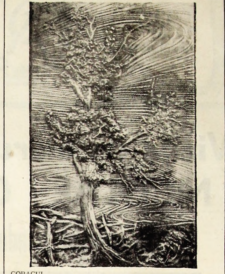
COPACUL Metaloplastie de Oskar Brăutigan