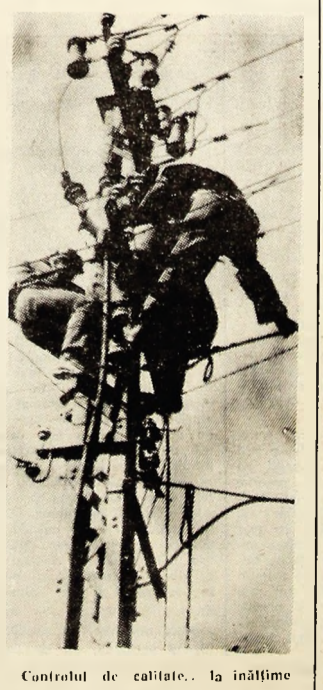
Controlul de calitate... la înălțime

mații — a venit răspunsul, spre stupefacția noastră. Doar livrarea apei de către I.G.C. se face în cantități insuficiente. — Ne puteți oferi un exemplu? — Da! Vineri, simbădă și duminică nu am avut apă suficientă pentru baie. — Facem abstracție de faptul că gospodarul nu cunoaște adevărata față a lucrurilor (tocmai că momentan sînt nemulțumit, tovarășe Duc!) și reținem doar opțiunea acestuia: deci gospodarul știe că trei zile consecutiv lipsa unor cantități suficiente de apă a împiedicat un proces firesc de igienă corporală, dar nu consideră că acest fapt ar fi putut produce nemulțumiri. — O scută viziă prin sălile de baie și vestiare ne prilejuiește și alte constatări. Astfel, vestiarele nu pot fi spălate corespunzător