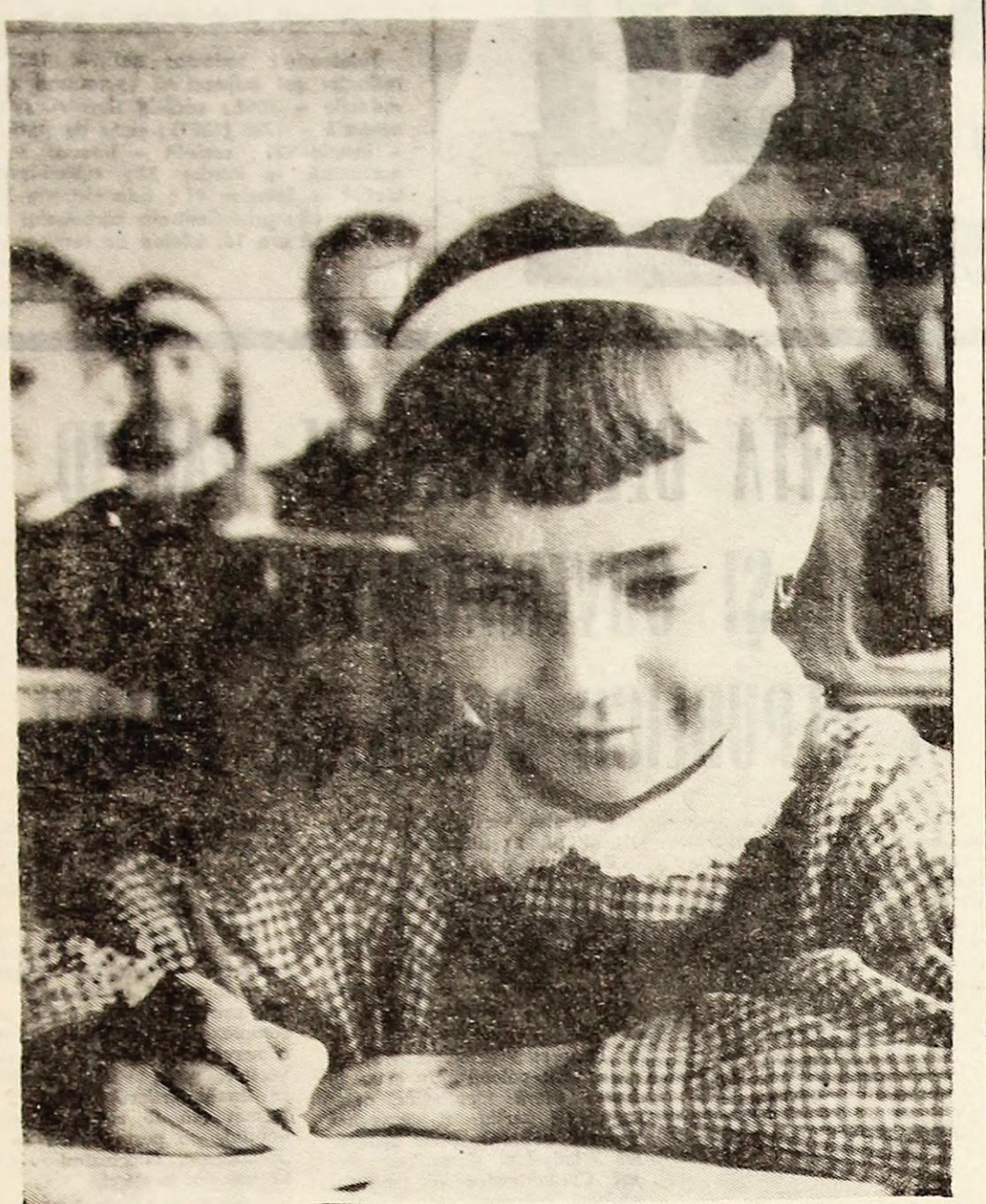
Descifrînd primele taine ale cunoașterii...