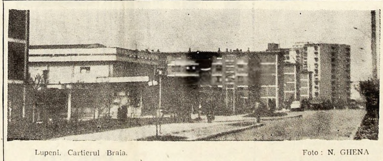
Lupeni, Cartierul Braia.