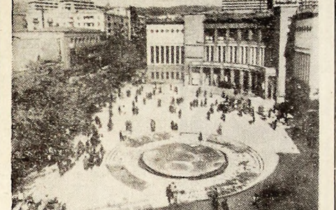
U.R.S.S. Vedere panoramică asupra Pieții Cinematografului „Moscovita” din centrul orașului Erevan, R.S.S. Armeană.

● În urma unor lupte violente cu trupele regimului Lon Nol, forțele de rezistență populară din Cambodia au ocupat orașul Treoung, situat pe soseaua nr. 7 - una dintre principalele artere de circulație ale țării.