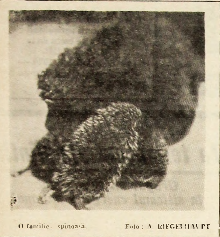
O familie... spinoasă.

Recent, la comisariatul de poliție din Londra s-a anunțat furatul unui cine lup. Neavînd prea mare încredere în chei, stăpînul lui îl lăsa în automobil cu să-l păzească în timp ce el lipsește. „Paznicul” a fost însă furat.