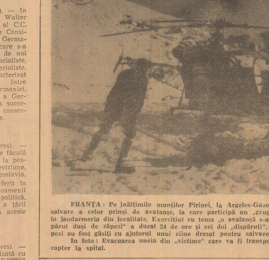
FRANȚA: Pe înălțimile munților Pirinei, la Argeles-Gazost se desfășoară exerciții de salvare a celor prinși de avalanșe. La care participă un grup specializat de parașutiști...

MOSCOVA 2 (Agerpres). — La 31 decembrie, Radioteleviziunea sovietică a transmis alocuțiunea lui L. Brejnev în care acesta a felicitat poporul sovietic cu prilejul Anului nou.