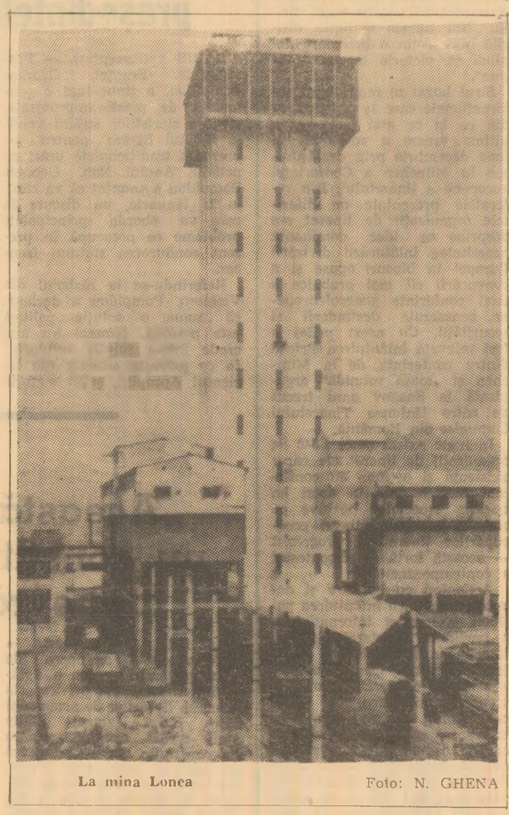
La mina Lonea