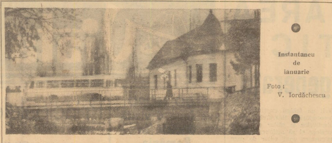
Instantaneu de ianuarie

Vizita de lucru a secretarului general al partidului în unități industriale din municipiul și județul Brașov, acum, la început de nou an, de nou cîincinal, a prilejuit colectivelor de muncitori, ingineri și tehnicieni, o dată cu bucuria de a-l avea în mijlocul lor pe tovarășul Ceaușescu, de a putea raporta partidului primele succese dobîndite în îndeplinirea sarcinilor planului pe 1971 și exprimarea hotărîrii de a-și consacra toate forțele în vederea trecerii în viață a obiectivelor stabilite de partid pentru progresul României socialiste.