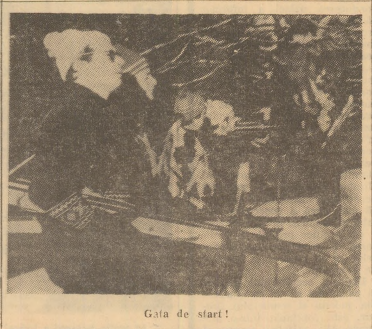
Gala de start!