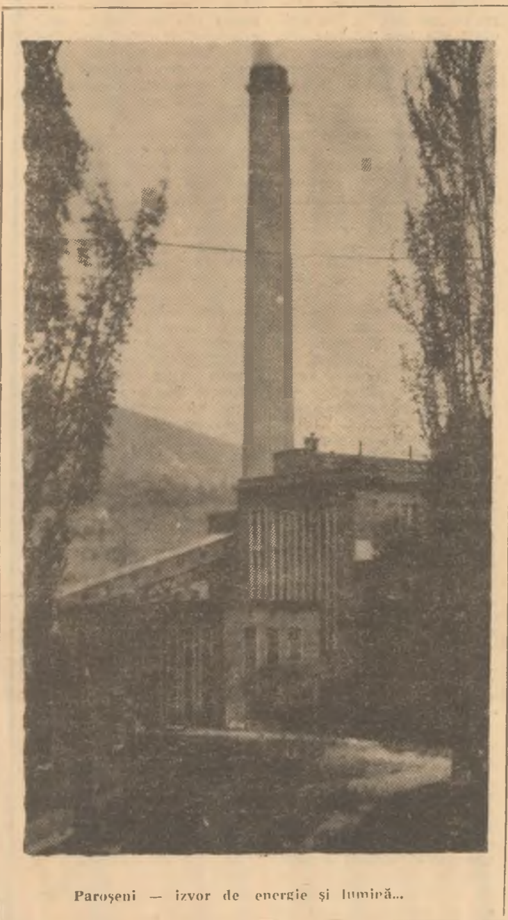
Petroșani — izvor de energie și lumină...