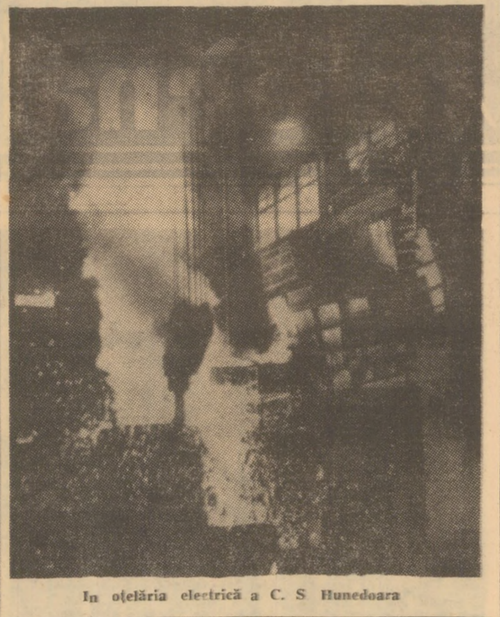
În oțelăria electrică a C. S. Hunedoara