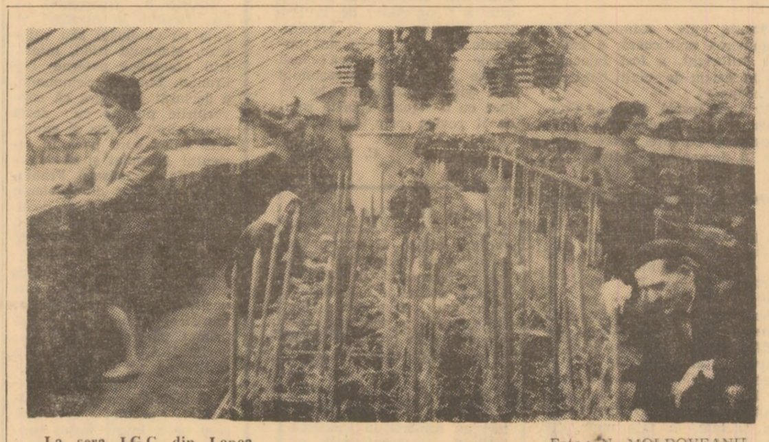
La sera I.G.C. din Lonea

recti, aruncă anatema asupra muncii cinșite a altora. Nu pricepem în ce scop induc în eroare un organ de partid care a treburi mult mai serioase decît să umbie după niște nedovăduri. Dacă este așa cum scriu ei la ziar, de ce nu semnează, de ce nu au curajul răspunderii. Astăzi fiecare cetățean al țării noastre are dreptul să-și exprime deschis și deplin părerea în cele mai diverse treburi obștete. Asemenea indivizi care infestază colectivitatea cu modul lor de a gândi, de a judeca și de a se comporta în relațiile cu semenii lor trebuie trași la răspundere, împotriva lor trebuie făcută o linie de masă puternică, activă.