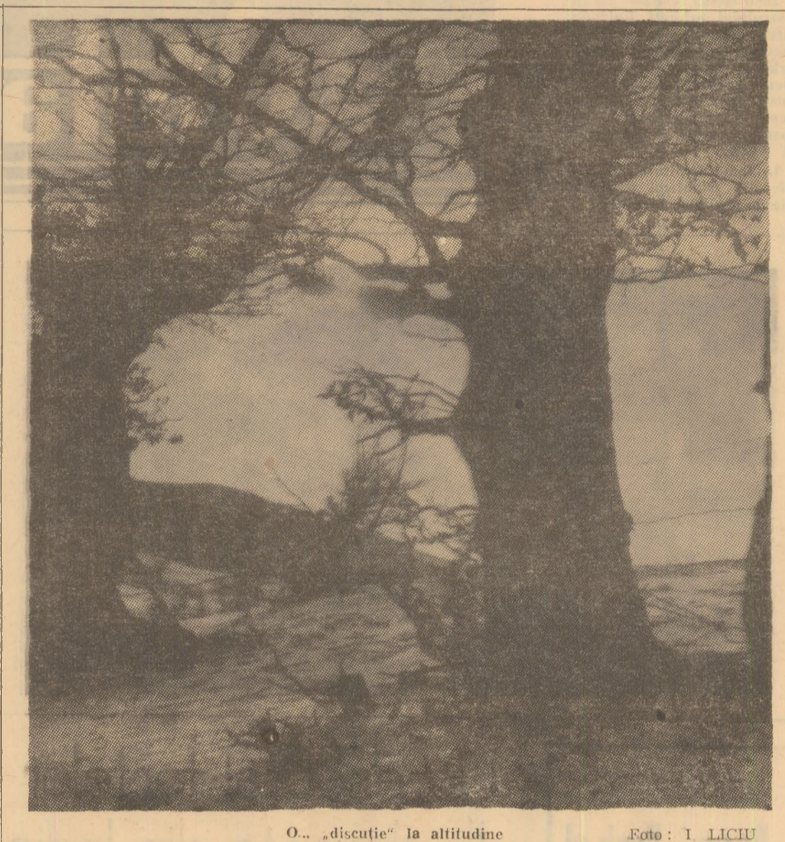
O... „discuție” la altitudine