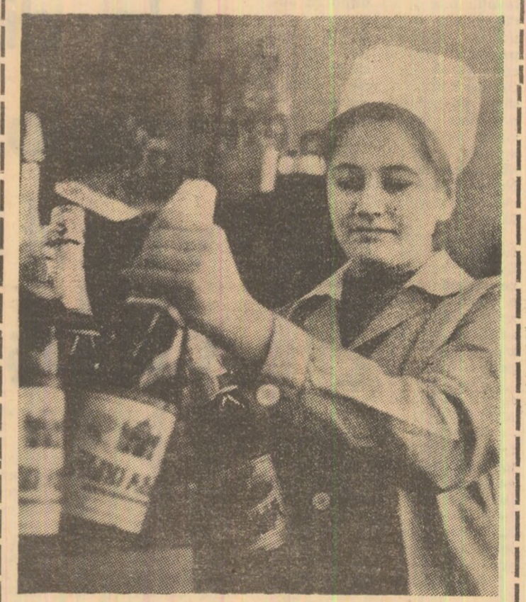
Politiți cu încredere la „Autoservirea” din cartierul „Aeroport”

menajările ce-i sînt destinate. Clubul despre care vorbim, preciza Gh. Negruț, va avea un profil distinct, unic în Valea Jiului. Mai întii vom face un sondaj de opinie pentru a putea observa cu mai multă fidelitate care sînt preferințele actuale. Noi îl vedem deschis tuturor celor care doresc să petreacă timpul liber într-un cadru primitor, existînd posibilitatea unor audii muzicale diverse, lecții de publicitate, discuții tematice la care să fie invitate persoane competente, capabile să limpezescă detaliile mai obscure sau mai puțin cunoscute. Ne gîndim că membrii să posede legitimități și să contribuie cu o cotizație oarecare, adunată în