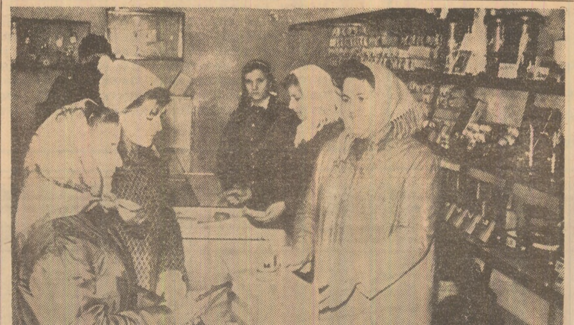
Noul magazin de vinzare a articolelor electrice din Petroșani, renovat și amenajat corespunzător cunoaște o afluență sporită de cumpărători.

Eugenia DAMIENESCU (Continuare în pag. a 4-a)