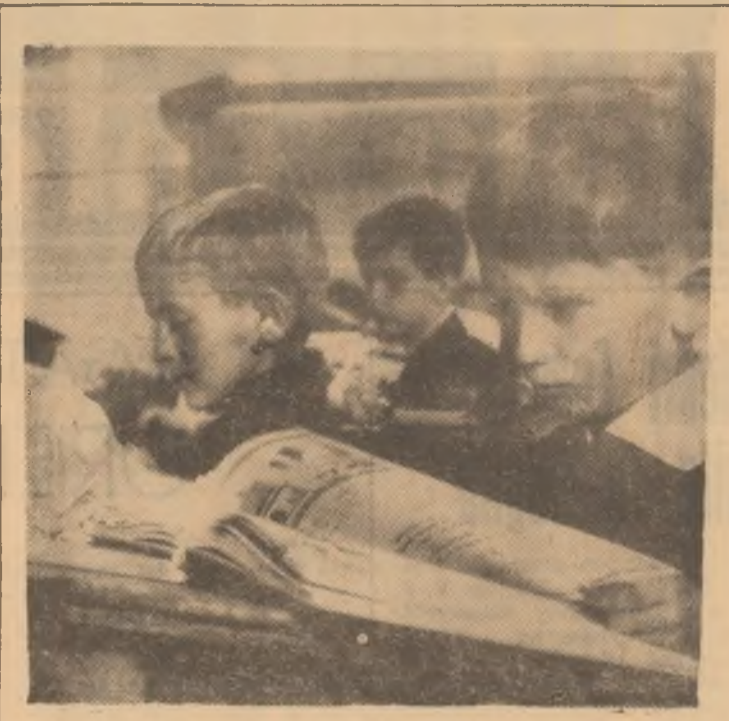
Nu mai... ochi și urechi

placă îmbunătățirea muncii de contractare, predare și plata drepturilor cetățenilor, activitatea în care anul trecut au existat serioase deficiențe pe linia livării furajelor concentrate, colecțiilor lapteului, primirea vitelor contractate, achitarea cu întârzieri de luni de zile a lapteului predat. Organele centrale de contractări animale și industrializare a cărnii Petroșani au datorat să simplifice formele de amenajare a acestor drepturi, să planifice baza de recepție la Bănită, promisă de afla timp, și să asigure personalul responsabil cu asigurarea veniturilor pentru muncitorii din cadrul comitetelor executive să acționeze în perioada optimă în vederea realizării contractărilor.