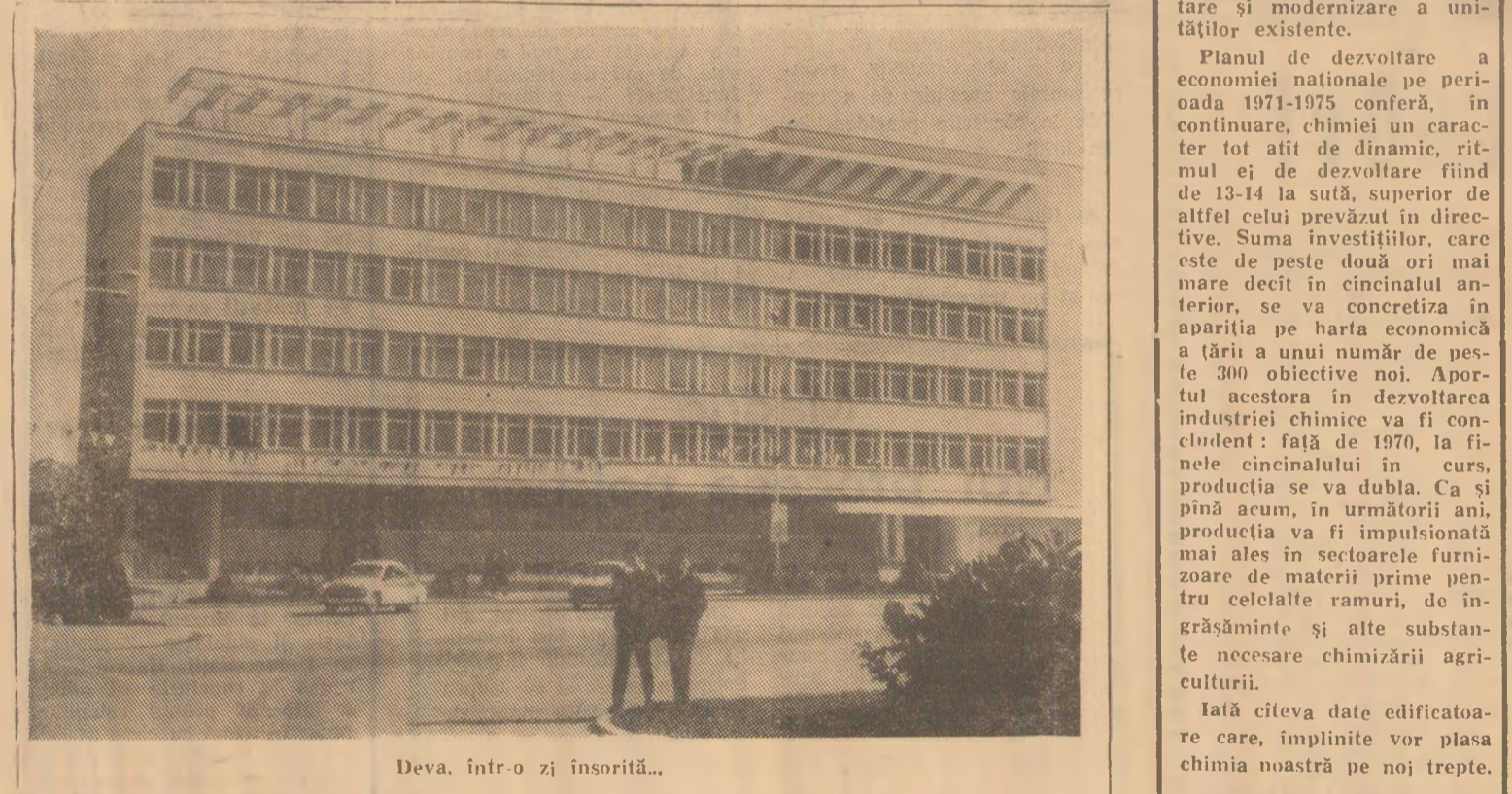
Deva, într-o zi însorită...