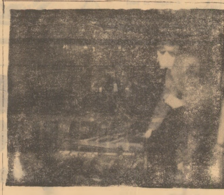
Aspect dintr-un abataj frontal din stratul 15, blocul V, Paroseni, unde tăierea se execută mecanic.

Executarea paralelă a mai multor operații diferite, apropiate muncii din abatajul mecanizat de sisteme de desfășurare în flux, cunoscut ca cea mai perfecționată formă de organizare în unitățile producătoare de materiale de masă.