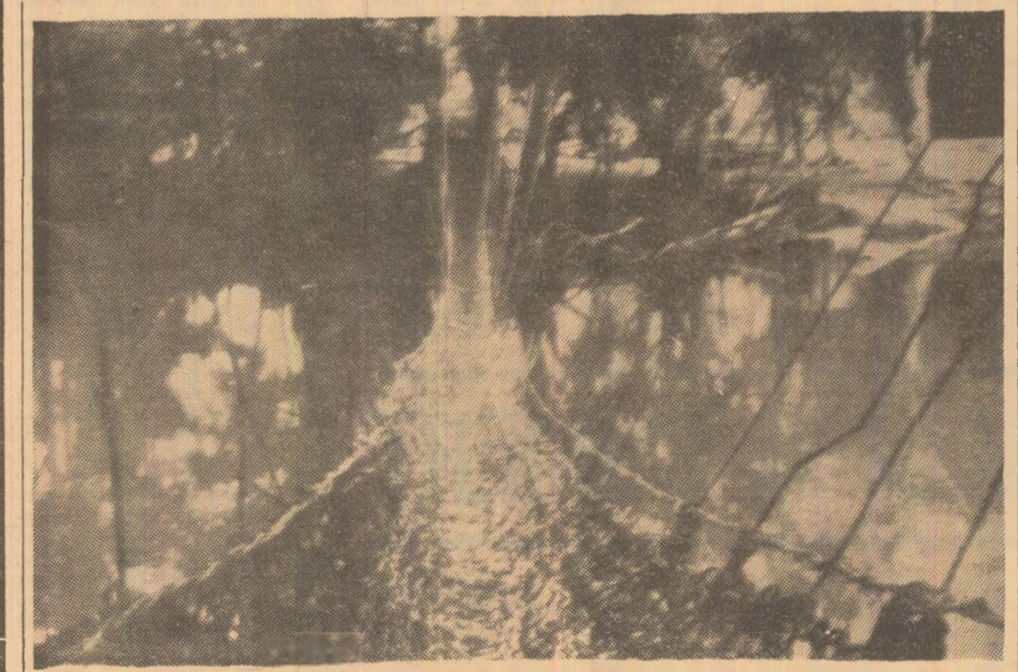
GUINEEA: Pod de liane peste fluviul Diani, în pădurea tropicală umedă. Podul este impletit numai din tulpinile lianelor, este deosebit de rezistent și în același timp, cel mai preferat mijloc de traversare a fluviului în acest sector unde fauna este bogată în crocodili.