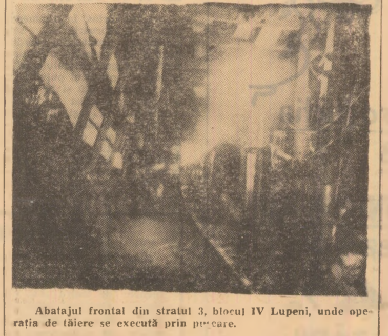
Abatajul frontal din stratul 3, blocul IV Lupeni, unde operația de tăiere se execută prin pucare.

găsirea de noi soluții de înlocuire a metodelor de exploatare de mică capacitate cu altele îmbunătățite; mecanizarea și modernizarea principalelor operații din cadrul procesului tehnologic al abatajelor cu front lung.