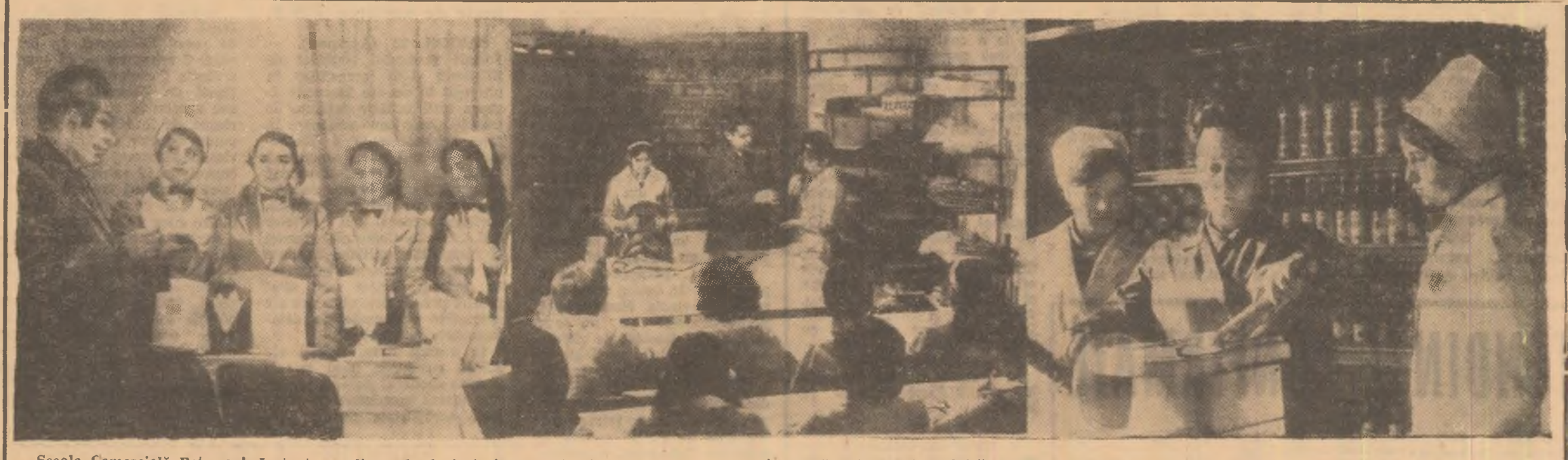
Școala Comercială Petroșani. Instantanee din orele de instruire practică în cele trei clase magazin-școală: alimentație publică, produse industriale, produse alimentare