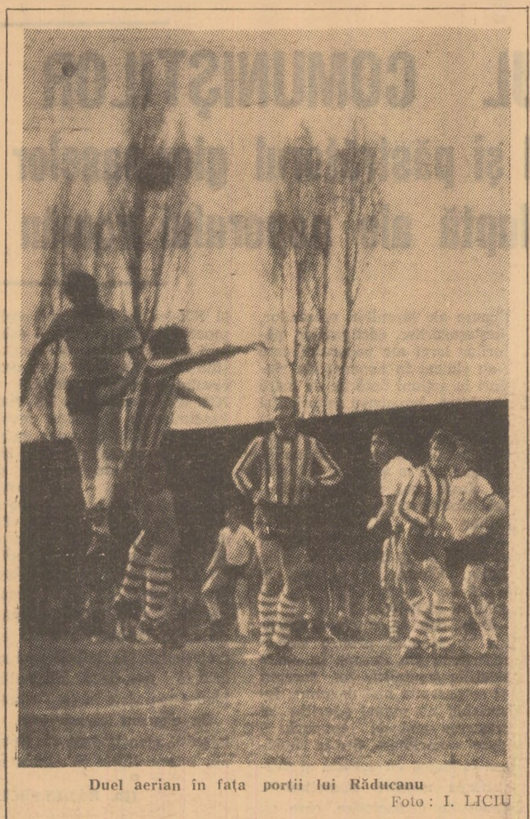
Duel aerian în fața porții lui Răducanu.