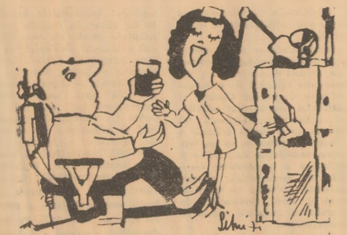
— Soră, apa din pahar e murdară... — Doar n-o beți, doamne sfinte!, vă clățiți gura și o aruncați aici...