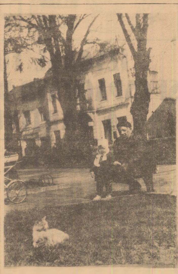
...Te-am visat azi noapte-n vis

De vreo 300 de ani, contribuabilii englezi suportă cheltuielile pentru repararea castelului Pillingham, care n-a existat niciodată. Castelul este rodul imaginației regelui Carol al II-lea, care a încusat pentru „reparații” (a se citi „banii de buzunar” ai majestății sale) o sumă suplimentară de 75 lire și 10 șilingi pe an. Tradiționalismul britanic nu se dezmente nici de data asta deoarece, deși oamenii știu foarte bine că undeva în Lincolnshire nu există nici un castel, varșă în continuare suma pentru fantomaticele reparații.