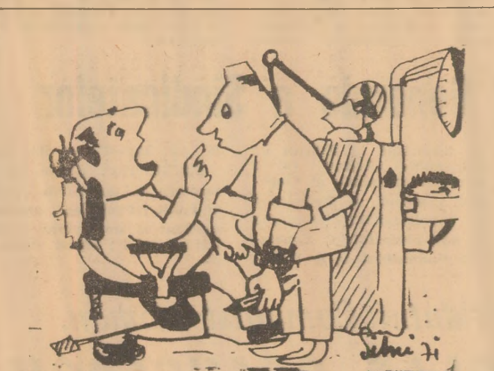
— Faceți extracții fără durere? — Nu înțeleg. Ieri, de exemplu, mi-am luxat încheietura la o extracție, de... și azi mă doare!