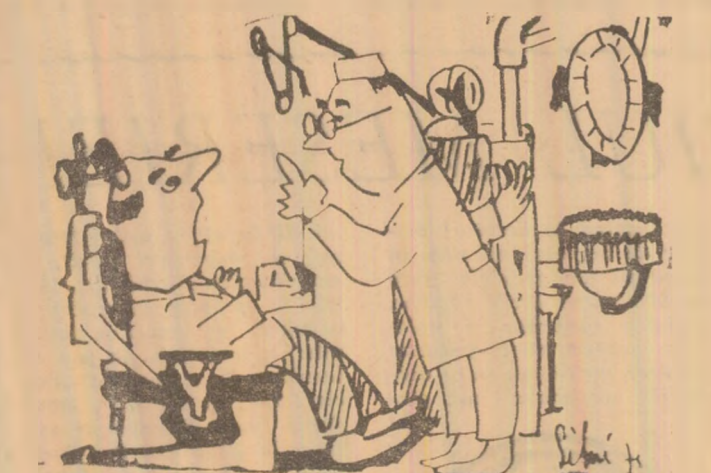
— Vai, dar nu măseaua aceea m-a durut! — Răbdare, ajungem și la cele rele...