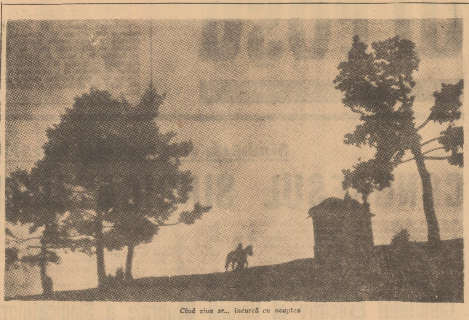
Când ziua se... încurcă cu noaptea