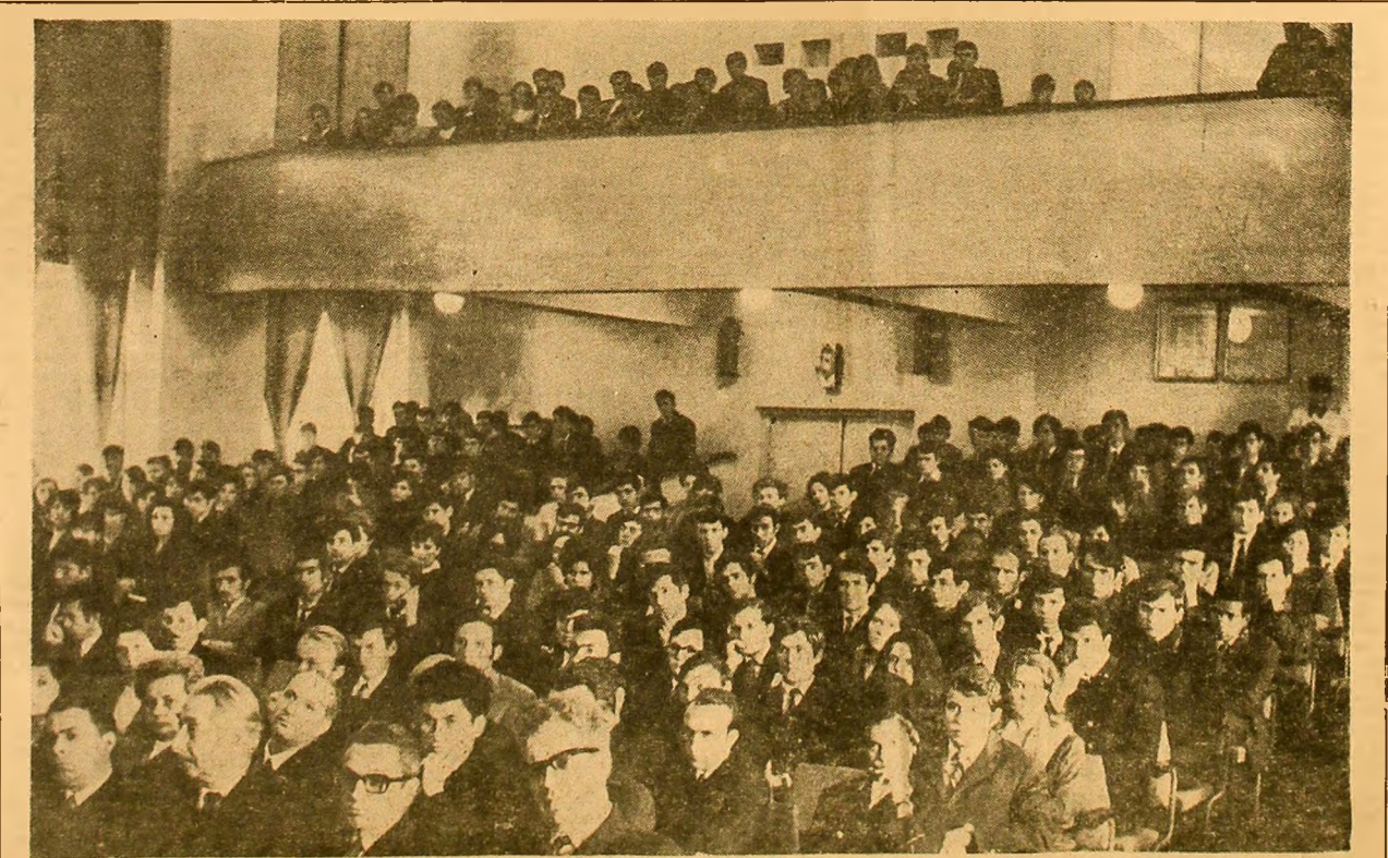
Aspect din aula Institutului de Mine din Petroșani în timpul festivității de deschidere a anului universitar.

CADRELE DIDACTICE ȘI STUDENȚII INSTITUTULUI DE MINE DIN PETROȘANI