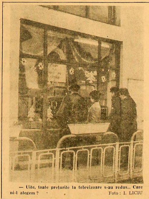
— Uite, toate prețurile la televiziune s-au redus... Care ni-l alegem?