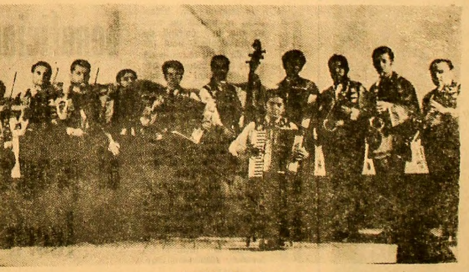
Taraful din Annoasa.

Sperăm că în curînd clubul din Uricani să-și reia activitatea în împlîntarea și modernă clădire din cen-trul orașului, trecînd peste toate impiedimentele, justifi-cate ori nu, care au încur-jat lucrurile pînă acum.