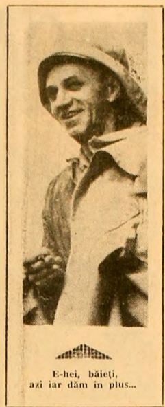
E-hei, băieți, azi iar dăm în plus...

Faptul că ne-am terminat planul pe 1971 cu o săptămîină înainte de termen ne face să abordăm sarcinile sporite pe noul an cu încredere. Este adevărat că se va schimba structura producției, iar investiția pe tonă de metal pentru prelucrare reprezintă o creștere însemnată. Vom produce sortimente complexe, cu un înalt grad de tehnicitate și sortimente noi, unicate, unele concepute chiar în Valea Jiului. Am pregătit deja producția grinzilor pentru abataje, noul tip Îmbunătățit în proporție de 101,1 la sută.