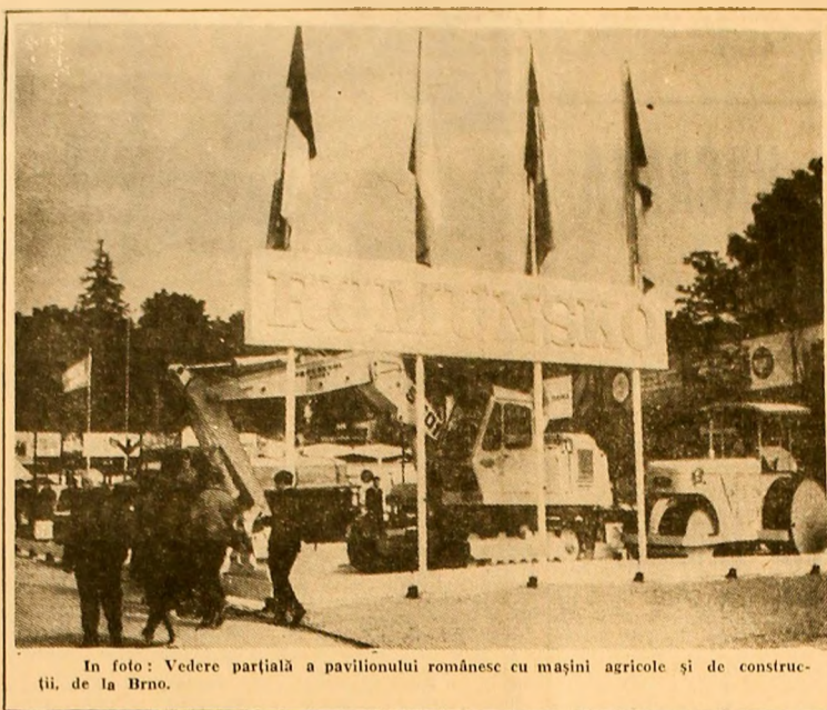
In foto: Vedere parțială a pavilionului românesc cu mașini agricole și de construcții, de la Brno.

(Urmare din pag. 1) pregăti fabricarea altor două tipuri de tractoare de 20 și 30 C.P., deosebit de solicitate atât pe piața internă cât și la export. Căutările creatoare continuă. La Institutul de cercetări și proiectări pentru tractoare și autocamioane se află în studiu un tip de tractor perfecționat cu o putere de 360-400 C.P. destinat lucrărilor industriale agricole.